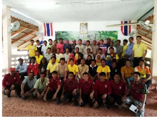
โครงการฝึกอบรมอาสาสมัครเฝ้าระวังป้องกันและควบคุมไฟฟ้าทุ่งทะเล

5. ทำให้คุณภาพชีวิตของราษฎรในเขตตำบลเกาะกลาง อำเภอกะลันตา จังหวัดกระบี่ ดีขึ้น