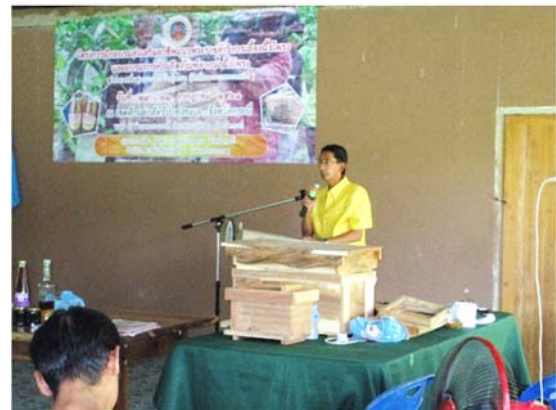
โครงการฝึกอบรมส่งเสริมอาชีพแนวพระราชดำริเลี้ยงผึ้งโพรง