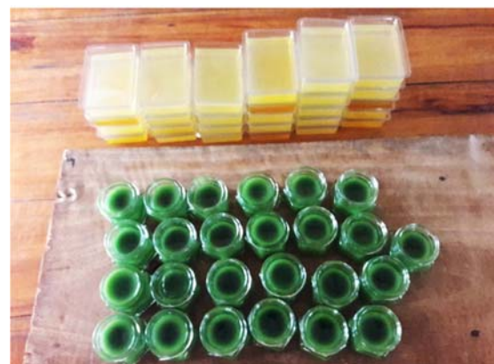
การฝึกอบรมการทำผลิตภัณฑ์จากน้ำผึ้งโพรง