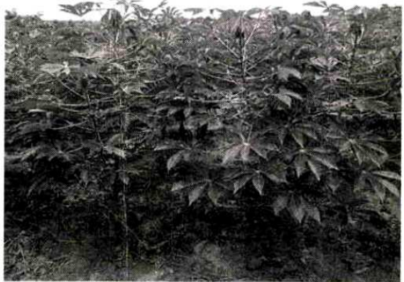
เพชรบูรณ์ กำแพงเพชร นครสวรรค์ อุทัยธานี ชัยนาท ลพบุรี กาญจนบุรี ชลบุรี ละโว้สงขลา สระแก้ว และปราจีนบุรี

นอกจากนี้ ยังมอบหมายให้ศูนย์ส่งเสริมเทคโนโลยีการเกษตร ด้านอารักขาพืชจังหวัดชัยนาทลงพื้นที่ ให้คำแนะนำการใช้เชื้อ ราไตรโคเดอร์มา ควบคุมปัญหาโคนเน่า-หัวเน่ามันสำปะหลังใน