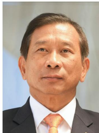
พล.อ.ฉัตรชัย สาริกัลยะ

การประชุมดังกล่าวถือเป็นเวทีในการให้ประชาคมชลประทานทั่วโลกพบปะหารือแลกเปลี่ยนความคิดเห็นหาแนวทางร่วมกันในการพัฒนางานด้านการชลประทานและการระบายน้ำ และจะหารือร่วมกันในหัวข้อการบริหารจัดการน้ำภายใต้สภาวะการเปลี่ยนแปลงของโลก : บทบาทการชลประทานต่อความยั่งยืนด้านอาหาร โดยมีเป้าหมายสำคัญ 3 ประการ ได้แก่ 1.การแสวงหาแนวทางการบริหารจัดการเพื่อสร้างความสมดุลระหว่างน้ำ อาหาร พลังงานและระบบนิเวศ 2.ร่วมกำหนดวิธีการรับมือที่เหมาะสมกับสภาพการเปลี่ยนแปลงของภูมิอากาศที่มีผลต่อปริมาณน้ำทั้งอุทกภัยและภัยแล้ง อย่างเช่น สถานการณ์ภัยแล้งที่กำลังคุกคามประเทศไทยในขณะนี้ เราจะมีวิธีการในการรับมืออย่างไรให้ผ่านวิกฤตน้ำแล้ง จะลดปริมาณการใช้น้ำของทุกภาคส่วน หรือจะ