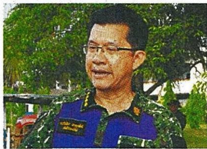
ธีรภัทร ประยูรสิทธิ

นายธีรภัทร ประยูรสิทธิ ปลัดกระทรวงเกษตรและสหกรณ์ เปิดเผยว่าปัจจุบันปริมาณน้ำใน 4 เขื่อนหลักได้แก่เขื่อนภูมิพล เขื่อนสิริกิติ์ เขื่อนแควน้อยบำรุงแดน และเขื่อนป่าสักชลสิทธิ์ มีปริมาณน้ำในอ่างฯ 10,329 ล้าน ลบ.ม. หรือ 42% ของความจุอ่าง และมีปริมาณน้ำใช้การได้ 3,633 ล้าน ลบ.ม.หรือ 20% ในขณะที่ประมาณการ