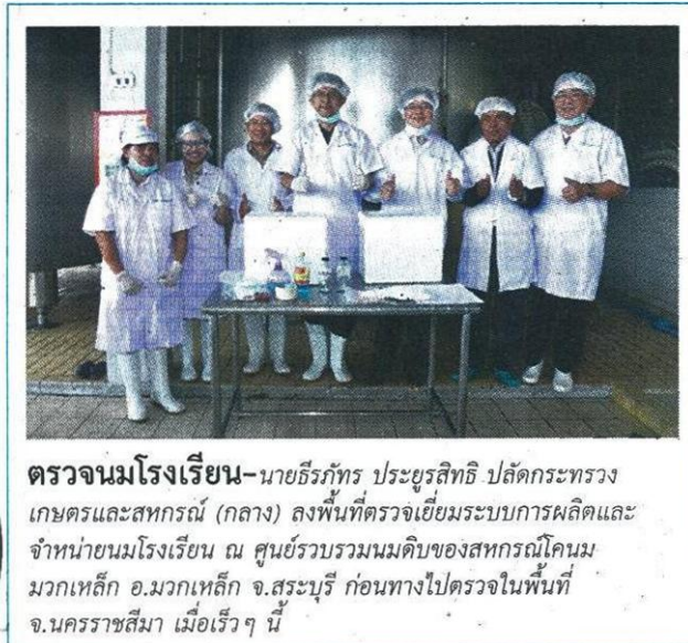
ตรวจนมโรงเรียน-นายธีรภัทร ประยูรสิทธิ ปลัดกระทรวง เกษตรและสหกรณ์ (กลาง) ลงพื้นที่ตรวจเยี่ยมระบบการผลิตและ จำหน่ายนมโรงเรียน ณ ศูนย์รวบรวมนมดิบของสหกรณ์โคนม มวกเหล็ก อ.มวกเหล็ก จ.สระบุรี ก่อนทางไปตรวจในพื้นที่ จ.นครราชสีมา เมื่อเร็วๆ นี้