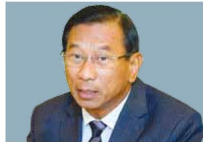
พล.อ.ฉัตรชัย สาริกัลยะ

ทั้งนี้ตามสัญญาแนบท้ายที่ให้หนานต้องซื้อยางจากอ.ส.ย.อีก 2 แสนตัน สิ้นสุดสัญญาเดือนมี.ค.2559