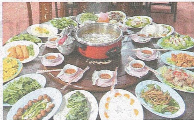
ไร่ชาอุยพง ไร่ชาชื่อดังอยู่ที่บ้านพญาไพร จ.เชียงราย สุกียูนาน บูทีโฮเทล ร้านอาหารวังพุดตาล แม่สลอง