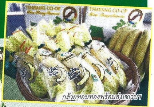
กล้วยหอมทองพร้อมส่งเซเว่นฯ

ปัจจุบันกล้วยหอมกลายเป็นพืชเศรษฐกิจที่น่าสนใจ สามารถสร้างรายได้ให้แก่เกษตรกรผู้ปลูกได้เป็นอย่างดี เนื่องจากเป็นที่ต้องการของตลาดทั้งในประเทศและต่างประเทศ ทำให้ราคากล้วยหอมพุ่งขึ้นเกือบเท่าตัวเมื่อเทียบกับปีที่ผ่าน มา จะเห็นจากราคาขายปลีกตามท้องตลาด จากเดิมราคาผลละ 3 บาท ปัจจุบันราคาอยู่ที่ละ 5-12 บาท หากดูข้อมูลจากสำนักงานเศรษฐกิจการเกษตร (สศก.) ระบุว่า ในปี 2556 ประเทศไทย มีพื้นที่ปลูกกล้วยหอมทั้งประเทศ 86,270 ไร่ ส่วนใหญ่อยู่ในพื้นที่ของภาคกลาง โดยเฉพาะ จ.ปทุมธานี มีพื้นที่ปลูกมากที่สุด 14,170.5 ไร่ ตามด้วย จ.เพชรบุรี 8,956 ไร่ ชุมพร 8,507 ไร่ สระบุรี 3,997 ไร่ และหนองคาย 3,254 ไร่ มีผลผลิตรวม 234,220 ตัน ใช้น้ำบริโภคภายในประเทศ 232,689 ตัน ส่งออกต่างประเทศ 1,531 ตัน