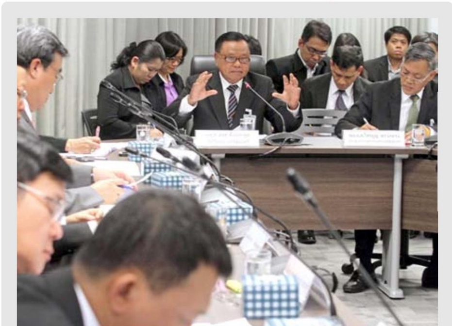
แก๊งตลก - พล.อ.สกล ชื่นตระกูล ที่ปรึกษานายกรัฐมนตรี เป็นประธานประชุมเพื่อแก้ไขปัญหาราคายางตกต่ำร่วมกับหน่วยงานที่เกี่ยวข้อง หลังจากทีคณะรัฐมนตรี (ครม.) มีมติให้องค์การคลังสินค้า (อคส.) เข้าไปรับซื้อขายพาราจากเกษตรกร ที่ขึ้น 5 ตึกปัญหาการ 2 ทำเนียบรัฐบาล

“สิ่งที่ทหารเข้ามาในวันนี้ เพื่อทำทุกอย่างเพื่อให้เกิดพื้นฐาน วันหน้าเมื่อถึงเวลา ท่านก็ไปว่ากันเอาเองตามกระบวนการประชาธิปไตย ก็ไปเลือกมาให้ดีก็แล้วกัน จะทำต่อหรือไม่ ก็แล้ว แต่โดยการรับซื้อขายพารา ไม่ใช่อยู่ดีๆ จะไป