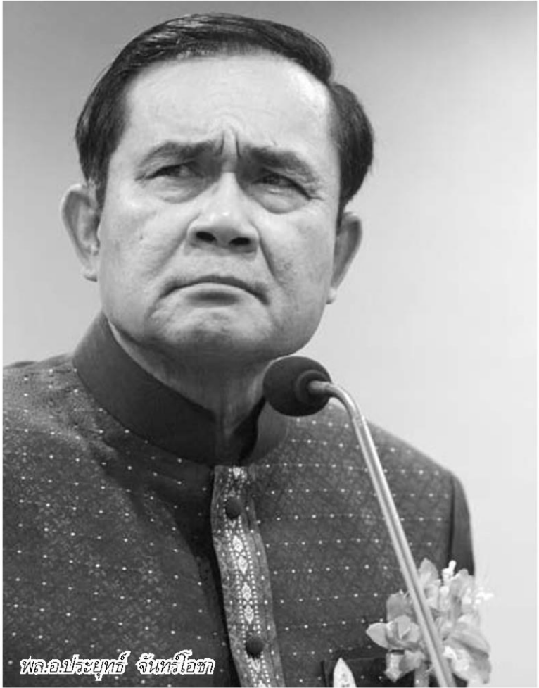
พล.อ.ประยุทธ์ จันทร์โอชา

ยังต้องมีอยู่ต่อไป โดยเฉพาะเรื่องเศรษฐกิจปากท้องอาจจะหนักกว่าเดิมด้วยซ้ำไป เพราะปัญหามานอกยังไม่เ็นหัวดีขึ้นเลย และยังซ้ำเติมด้วยภัยแล้งที่มาเร็วกว่ากำหนด