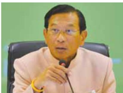
พล.อ.ฉัตรชัย สาริกัลยะ

นายเชาว์ กล่าวว่า ขณะนี้ราคายางในตลาดเริ่มปรับตัวสูงขึ้นที่ 42 บาทต่อกก. โดยเป็นผลจาก