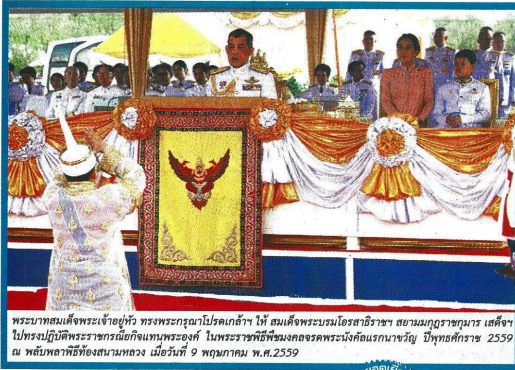
พระบาทสมเด็จพระเจ้าอยู่หัว ทรงพระกรุณาโปรดเกล้าฯ ให้ สมเด็จพระบรมโอรสาธิราชฯ สยามมกุฎราชกุมาร เสด็จฯ ไปทรงปฏิบัติพระราชกรณียกิจแทนพระองค์ ในพระราชพิธีพืชมงคลจรดพระนังคัลแรกนาขวัญ ปีพุทธศักราช 2559 ณ พลับพลาพิธีท้องสนามหลวง เมื่อวันที่ 9 พฤษภาคม พ.ศ.2559

หัวข้อข่าว: ทำนายศก.รุ่งเรือง น้ำท่าพอดี-ข้าว-อาหารบริบูรณ์พสกนิกรปลื้มรับเสด็จพระบรมฯ