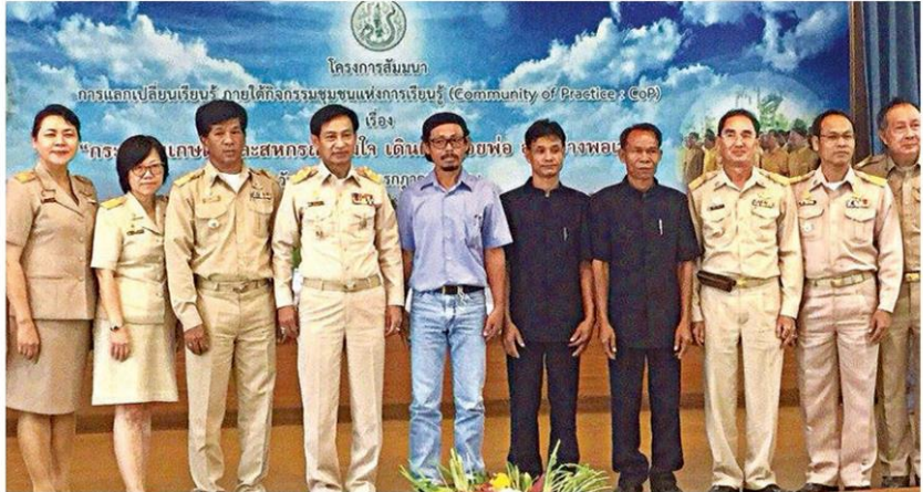
รองปลัดกระทรวงฯ เปิดงาน

ทำงานจากผู้บริหารข้าราชการ ราษฎรชาวบ้าน และนักวิชาการ รวมถึงการสร้างความสัมพันธ์ที่ดีร่วมกันระหว่างเจ้าหน้าที่ พร้อมกันนี้ได้รณรงค์ให้เจ้าหน้าที่ได้ดำรงชีวิตโดยยึดหลักปรัชญาของเศรษฐกิจพอเพียง ทั้งนี้ จาก