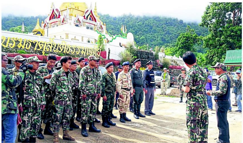
เจ้าหน้าที่กรมป่าไม้ชุดพญาเสือ ตรวจสอบบริเวณวัดลิเจีย หมู่ 4 ต.ปรางค์ผล อ.สังขละบุรี จ.กาญจนบุรี หลังได้รับการร้องเรียนว่าพื้นที่วัดมีการรุกที่อุทยานแห่งชาติเขาแหลม และแบ่งล็อกขายให้กลุ่มนายทุนที่เป็นลูกศิษย์วัด

อย่างไรก็ตาม จากการประชุมร่วมกับ หน่วยงานที่เกี่ยวข้องยังไม่มียุทธศาสตร์ การขจัดขวางหรือการปะทะในพื้นที่ ทั้งนี้ ได้สั่งการให้ดำเนินการตามมาตรา 44 เลี่ยงการปะทะกับประชาชน แต่หากพื้นที่ ใดมีการขัดขวางให้แจ้งความดำเนินคดี กรณีขัดขวางการปฏิบัติงานของเจ้าหน้าที่ สำหรับการจัดสรรที่ดินให้กับประชาชน ที่ไร้ที่ดินทำกินและเกษตรกรไร้ที่ดินทำกิน จะเป็นไปตามเกณฑ์ของคณะกรรมการ นโยบายที่ดินแห่งชาติ (กทช.) ซึ่งมีกระทรวง