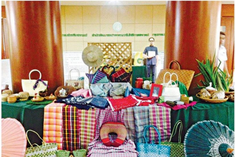
แสดงผลผลิต