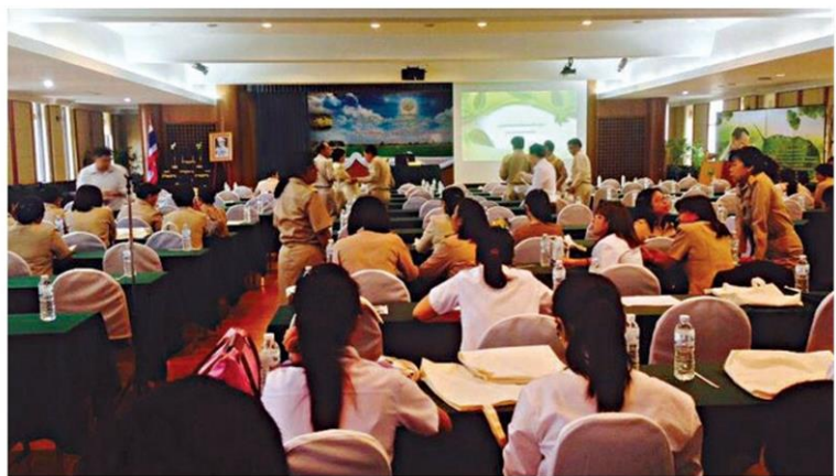
ผู้เข้าร่วมสัมมนา