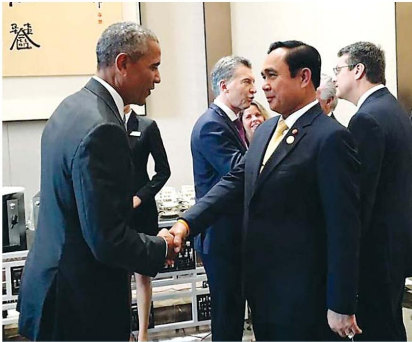
■ จี20 ■ พล.อ.ประยุทธ์ จันทร์โอชา นายกรัฐมนตรี ทักทายนายบารัค โอบามา ประธานาธิบดี สหรัฐอเมริกา ในการประชุมผู้นำกลุ่ม จี 20 ที่นครทางโจว มณฑลเจ้อเจียง สาธารณรัฐประชาชนจีน ระหว่างวันที่ 4-5 ก.ย.