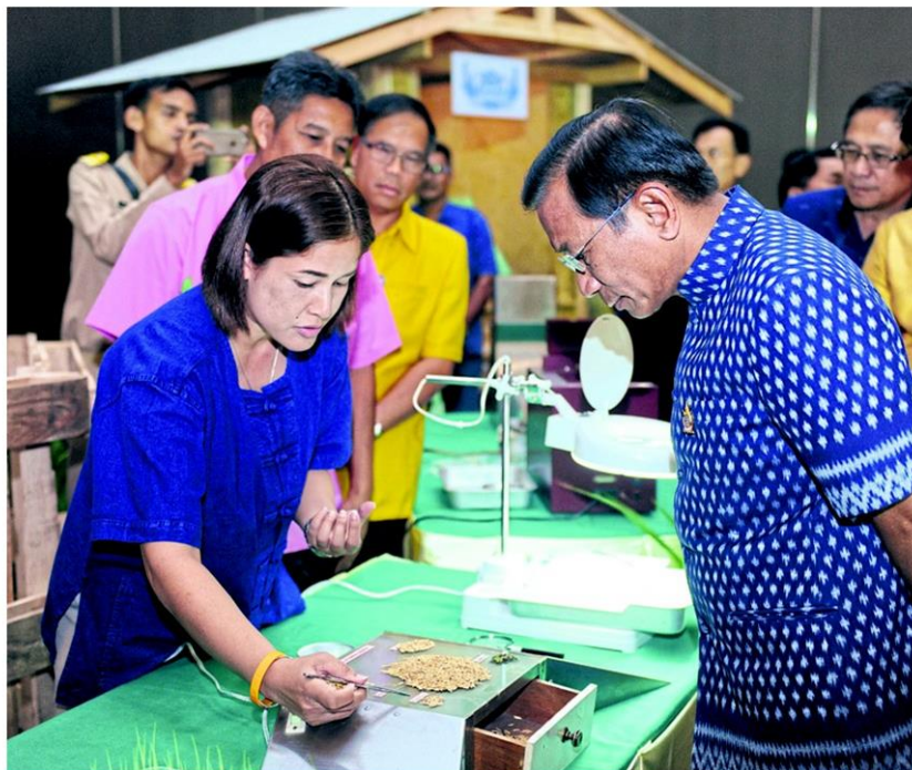
ศูนย์ข้าวชุมชน : พล.อ.ฉัตรชัย สาริกัลยะ รัฐมนตรีและสหกรณ์ เป็นประธาน เปิดการสัมมนาศูนย์ข้าวชุมชนกับการพัฒนานาแปลงใหญ่อย่างมั่นคง มั่งคั่ง และ ยั่งยืน และเยี่ยมชมศูนย์ฯ เมื่อ 5 ก.ย.ที่ผ่านมา พร้อมชี้แจงนโยบายและแผน พัฒนาข้าวของประเทศเพื่อสร้างความเข้มแข็งให้องค์กรเกษตรกร