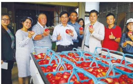
ชมผลผลิต

โครงการนี้มีเป้าหมายเพื่อส่งเสริมความรู้ และประสบการณ์เกี่ยวกับการทำ