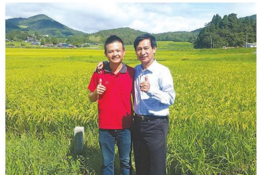
รองปลัดฯ กับเยาวชนเกษตรไทยในแปลงนาที่ญี่ปุ่น