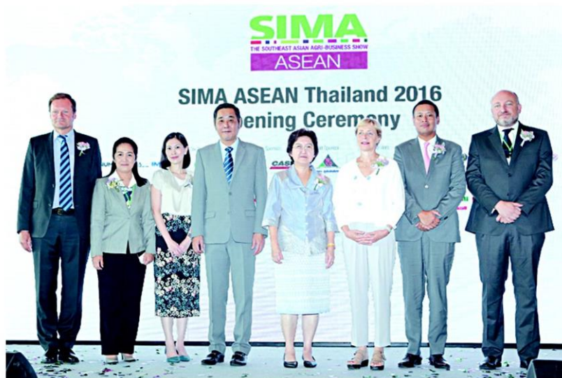
↑ ธุรกิจการเกษตร...จินตนาชัยวรรณการ พช.รมว.เกษตรและสหกรณ์ เปิดงาน SIMA ASEAN Thailand 2016 งานแสดงสินค้าและการประชุมนานาชาติเพื่อธุรกิจการเกษตรในภูมิภาคอาเซียน ครั้งที่ 2 โดยมี วาเลรี ลอบรี ครีองเซ่ ลอย จุน ฮาว และ จิรุตต์ อิศรางกูร ณ อยุธยา ร่วมงาน ที่อาคาร 5-6 อิมแพ็ค เมืองทองธานี