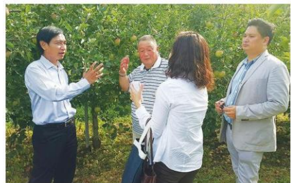
เยี่ยมชมการฝึกงานในแปลงฯ

กรมปศุสัตว์ สำนักงานการปฏิรูปที่ดินเพื่อเกษตรกรรม และสถาบันวิจัย พัฒนาพื้นที่สูง (องค์การมหาชน) จะเป็นหน่วยงานหลักในการคัดเลือกผู้แทนเยาวชนในอาชีพการเกษตรแขนงต่างๆ เดินทางไปฝึกงานภาคการเกษตรกับครอบครัวเกษตรกรญี่ปุ่น