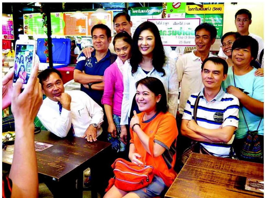
△ แอ่วห้าง - น.ส.ยิ่งลักษณ์ ชินวัตร ออกเดินห้างเซ็นทรัล เชียงใหม่ แอร์พอร์ต มีประชาชน เข้ามาขอถ่ายรูปด้วยเป็นจำนวนมาก โดยในวันที่ 15 ก.ย. อดีตนายกฯ จะเดินทางไปร่วม ทำบุญใหญ่ที่จ.ลำพูน

จากนั้นผู้ที่รับรางวัล กล่าวกับนายกฯว่า ชาวเชียงใหม่ฝากความระลึกถึงมา โดยนายกฯ ได้ถามว่าคิดถึงทุกคนหรือเปล่า บอกว่าคิดถึง ทุกคนมันเป็นไปได้ วันนี้ไม่พอใจไม่