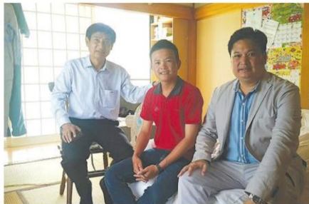
ติดตามเยี่ยมถึงห้องพักเยาวชนเกษตรไทย

ซึ่งหน่วยงานในสังกัดกระทรวงเกษตรฯ ที่เข้าร่วมโครงการ จำนวน 5 หน่วยงาน ได้แก่ กรมส่งเสริมการเกษตร กรมส่งเสริมสหกรณ์