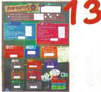
เปิดตัวแอป "OAE RCMO" กระดานเศรษฐกิจ ชี้ช่องรวยให้เกษตรกร