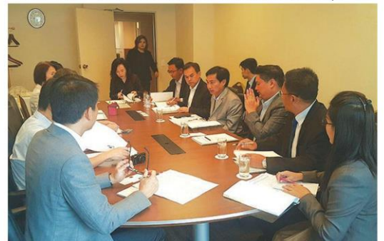
รองปลัดฯ ร่วมประชุมกับฝ่ายญี่ปุ่น

ปัจจุบันมีเยาวชนเกษตรได้เข้าร่วมโครงการ และไปฝึกงานในประเทศญี่ปุ่นแล้วกว่า 500 คน โดยสำนักการเกษตรต่างประเทศ เป็นหน่วยหลักในการบริหาร และติดต่อประสานงานกับหน่วยงานที่เกี่ยวข้องทั้งภายในและต่างประเทศ และให้การดูแลและสนับสนุนเยาวชนเกษตร ระหว่างการฝึกงานและภายหลังผ่านการฝึกงานจากประเทศญี่ปุ่น ตลอดจนการติดตามและประเมินผลโครงการ การจัดกิจกรรมและการต่อยอดโครงการเพื่อส่งเสริมบทบาทของผู้นำเยาวชนที่ผ่านการฝึกงานจากประเทศญี่ปุ่น ใน