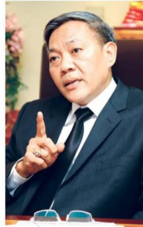
△ wa.ส.ก.อินสุบุญ ทรุดทอง

“ในวันที่ 9 มิถุนายนนี้ จะเรียกประชุมโรงสกัดน้ำมันปาล์มและโรงกลั่นน้ำมันปาล์ม รวมถึงผู้เกี่ยวข้องเพื่อหาทางรับมือ โดยปีนี้จะลดขั้นตอนต่างๆ เพื่ออำนวยความสะดวกให้เกษตรกรและโรงงานสกัดน้ำมันปาล์มให้เข้าถึงโครงการได้มากขึ้น อาทิ จะไม่จำกัดปริมาณและโรงงานที่จะเข้าร่วม ซึ่งเกษตรกรจะได้ประโยชน์คือใครอยู่ใกล้