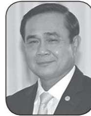
พล.อ.ประยุทธ์ จันทร์โอชา

แห่มๆ ที่พุดบนเวทีละพุดเก่ง พุดยาว แล้วเมื่อไหร่จะพุดกับสื่อเสียทีละคะ ท้นนายกฯ ฮ่าๆๆ