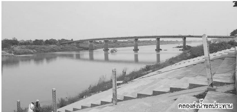
คลองส่งน้ำชลประทาน

อธิบดีกรมชลประทานกล่าวชี้แจงในประเด็นเดียวกันนี้