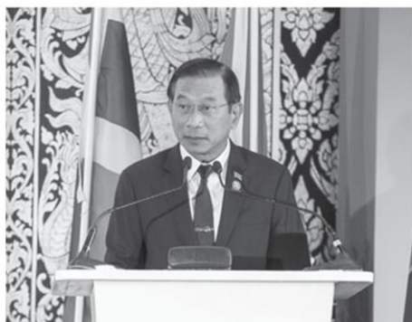
พล.อ.ฉัตรชัย สาริกัลยะ รัฐมนตรีว่าการกระทรวงเกษตรและสหกรณ์ เปิดเผยว่า ภาคเกษตรถือเป็น

โดยตลอดระยะเวลา 50 ปีที่ผ่านมา เป็นช่วงเวลาแห่งการเชื่อมประสานความร่วมมือกันอย่างเข้มข้นขึ้นเรื่อยๆ ระหว่างชาติสมาชิก ทั้งทางด้านการเมือง เศรษฐกิจ สังคม วัฒนธรรม และโดยเฉพาะด้านการเกษตร ซึ่งถือเป็นภาคส่วนที่เป็น “หัวใจหลัก” ของภูมิภาคอาเซียน