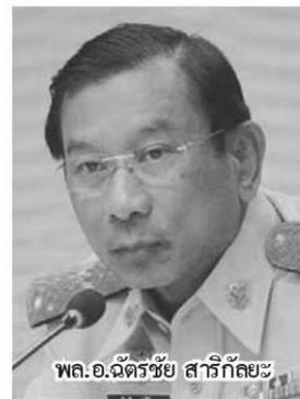
พล.อ.ฉัตรชัย สาริกัลยะ

ทั้งนี้ พล.อ.อภิรัชต์ ยืนยันด้วยว่าร่างกฎหมายนี้จะไม่มีการเก็บค่าใช้น้ำจากเกษตรกรรายย่อย โดยจะเก็บเฉพาะรายใหญ่เท่านั้น ซึ่งในรายละเอียดเรื่องการแบ่งเกษตรกรรายย่อย รายใหญ่ จะต้องออกเป็นกฎกระทรวงอีกครั้งและขณะนี้ได้ให้กรมทรัพยากรน้ำไปจัดทำหลักเกณฑ์เรื่องการกำหนดประเภทเกษตรกร เพราะเดิมกฎกระทรวงที่กรม