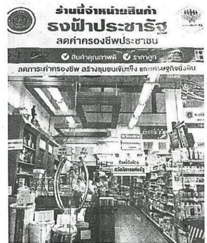
รมช.พาณิชย์ และอธิบดีกรมการค้าภายใน ลงพื้นที่ตรวจร้านธงฟ้าประชารัฐที่ร่วมโครงการสวัสดิการแห่งรัฐ

ร้านขนาดใหญ่ที่เข้มแข็งและมีกำลังอยู่แล้ว การนำเครื่องรูดบัตรไปติดตั้งคนมีรายได้น้อยเข้ามาซื้อสินค้าจึงเป็นการดึงเงินซื้อของจากคนจนแทนที่จะไปซื้อร้านเล็กๆ ช้างบ้านก็ถูกดึงมาไว้ที่ร้านใหญ่ที่มีเครื่องรูดบัตรเป็นหลัก