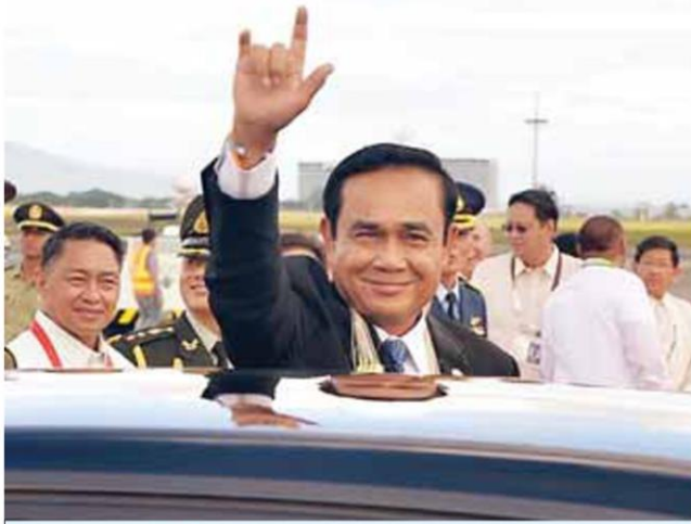
■ สุดยอดอาเซียน ■ พล.อ.ประยุทธ์ จันทร์โอชา นายกรัฐมนตรี ชูมือทักทายสื่อมวลชน หลังเดินทางถึงสาธารณรัฐฟิลิปปินส์ เพื่อเข้าร่วมการประชุมสุดยอดอาเซียน ครั้งที่ 31 ที่กรุงมะนิลา เมื่อวันที่ 12 พ.ย.