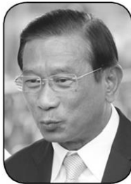
พล.อ.ฉัตรชัย สาริกัลยะ

W ww.thaipost.net ไทยโพสต์ “อัสราภาพแห่งความคิด” ในวันที่ “ลุงตุ๋” พล.อ.ประยุทธ์ จันทร์โอชา ไม่อยู่ เพราะไปประชุมสุดยอดผู้นำอาเซียนที่ฟิลิปปินส์ แต่ “พี่ตูน” อาทิวราห์ คงมาลัย ยังคงก้าวต่อไปด้วยความมุ่งมั่น ท่ามกลางเสียงเชียร์.. พี่ตูน ลู๊ๆ...● อนาคต “พี่ตูน” ในฐานะต้นแบบของสังคมไทย เป็นเรื่องน่าชื่นชมและต้องร่วมอนุโมทนา แต่ก้าวข้างหน้าของ “ลุงตุ๋” ซักง่อนแง่นไม่น่าไว้วางใจ หากการปรับ ครม. ประยุทธ์ 5 เทียนยังไม่แกะมือเพื่อนพ้องพี่น้องทหารออกจากป่า...● เสียงหึ่งๆ ปิดกันให้แซดว่า ถ้า “พี่ตูน” เลือกปกป้องพี่น้องบูรพาพยัคฆ์แบบไม่สนใจเสียงสะท้อนของฝ่ายต่างๆ ละก็ ปรับ ครม.งวดนี้ไม่แน่นอน หมายถึงเก้าอี้นายกรัฐมนตรีอาจจะหลุดกันไปด้วย..ส่วนใครจะรอเสียงนั้น มีอยู่แล้วรูปร่างลั่นทนต์ตัวดำแดงใกล้เคียงกันเลย สรุปได้ว่ากรุงรัตนโกสินทร์ไม่สิ้นคนดีจ้า..อิอิ...● ก็ว่ากันไป!! ถึงแม้ดัชนีความนิยม “ลุงตุ๋” จะร่วงเดินสวนทางกับ “พี่ตูน” ที่ความรักความนิยมพุ่งกระฉูด แต่ก็ยังมีประชาชนอยู่มากมายอยากให้รัฐบาล คลช.บริหารบ้านเมืองต่อไปจนกว่างานการปฏิรูปประเทศไทยสำเร็จเข้ารูปเข้ารอย ฉะนั้นข้อเสนอแนะอยากเห็นการปรับ ครม.บางคนออกจาก ครม. ถือเป็นข้อมูลดีที่ “ลุงตุ๋” น่าจะเอาไปพิจารณานะ...● นิต้าโพลสดๆ ร้อนๆ ระบุว่า ประชาชนส่วนใหญ่ ร้อยละ 20.38 ระบุว่า กระทรวงเกษตรและสหกรณ์ควรปรับออกไปมากที่สุด ตามด้วยร้อยละ 16.07 กระทรวงพาณิชย์ และร้อยละ 7.27 กระทรวงการคลัง รวมทั้งร้อยละ 6.08 กระทรวงศึกษาธิการ...แล้ว ครม.ประยุทธ์ 5...พล.อ.ฉัตรชัย สาริกัลยะ จะรอดหรือ?...● อย่างไร