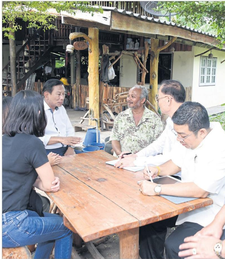
ตรวจเยี่ยม : พล.อ.ฉัตรชัย สาริกัลยะ รัฐมนตรีว่าการกระทรวงเกษตรและสหกรณ์ ลงพื้นที่ตรวจเยี่ยมผลการดำเนินงาน โครงการ “5 ประสาน สืบสานเกษตรทฤษฎีใหม่ ถวายในหลวง” ณ ศูนย์วิจัยและพัฒนาการเกษตรราชบุรี อ.โพธาราม จ.ราชบุรี พร้อมรับฟังสรุปโครงการเกษตรแปลงใหญ่