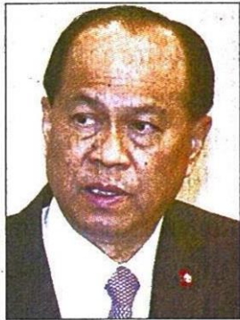
พล.อ.อนุพงษ์ เผ่าจินดา