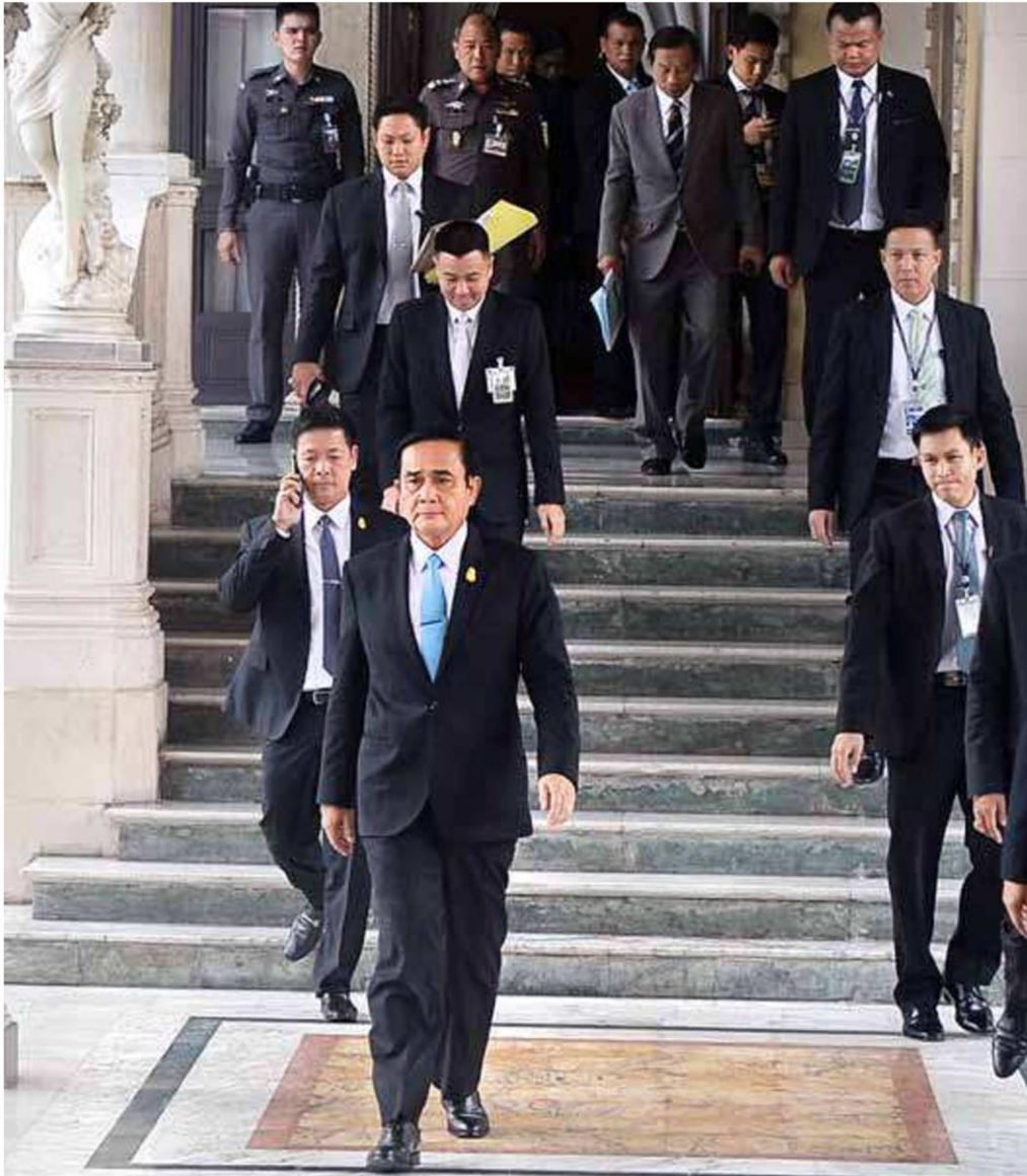
ประชุม นบข. : พล.อ.ประยุทธ์ จันทร์โอชา นายกรัฐมนตรี ประธานการประชุมคณะกรรมการนโยบายและบริหารจัดการข้าว (นบข.) ครั้งที่ 6/2560 ที่ ทำเนียบรัฐบาล วานนี้ (17 พ.ย.)

กรุงเทพธุรกิจ ● นายกาแงการปรับกรม.อยู่ในขั้นตอน ทูลเกล้าฯ คาดใช้เวลาไม่นานทุกอย่างเรียบร้อยล้นจัดใ ด้วยตัวเอง ระบุเป็นอำนาจนายกาฯ ยัน "ประวัติร-อนุพงษ์" ยังอยู่ครบ อูปไม่บอก "ฉัตรชัย" อยู่ไหน ย้ำชัดไม่ควม กลาใหม่ บัดทบทวม "จักรีทิพย์" นั่งรัฐมนตรี ระบุ ทำงานเดิมดีอยู่แล้ว เชื่อกรม.ใหม่จะสร้างความเชื่อมั่น