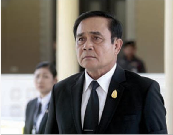
พล.อ.ประยุทธ์ จันทร์โอชา

จริงๆ จังๆ ช่วงโค้งวัดเบญจมฯ โค้งสุดท้ายก่อนเข้าวิน เน้นนอนว่า การปรับเพื่อกฎาพลิกชนัน แกไขความ ตกต่ำชั่วโมงนี้ก็ต้องเน้นไปที่กระทรวงเศรษฐกิจ ปากห้อง ถ้ามีอะไรมาทำงานช่วงสุดท้ายกันก็ได้ผลชะงัด ชาวบ้าน ลืมตาอ้าปากได้ ถือเป็นเครดิตรัฐบาลเต็มๆ ที่ทำเสียทำ พลาดมาอาจถูกลิ้มเลียนไปหมด ดังนั้น ต้องฟูมฟัก สวงาม คาดหวังจับต้องได้