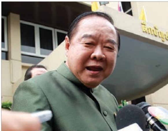
พล.อ.ประวิตร วงษ์สุวรรณ