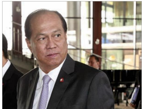
พล.อ.อนุพงษ์ เผ่าจินดา