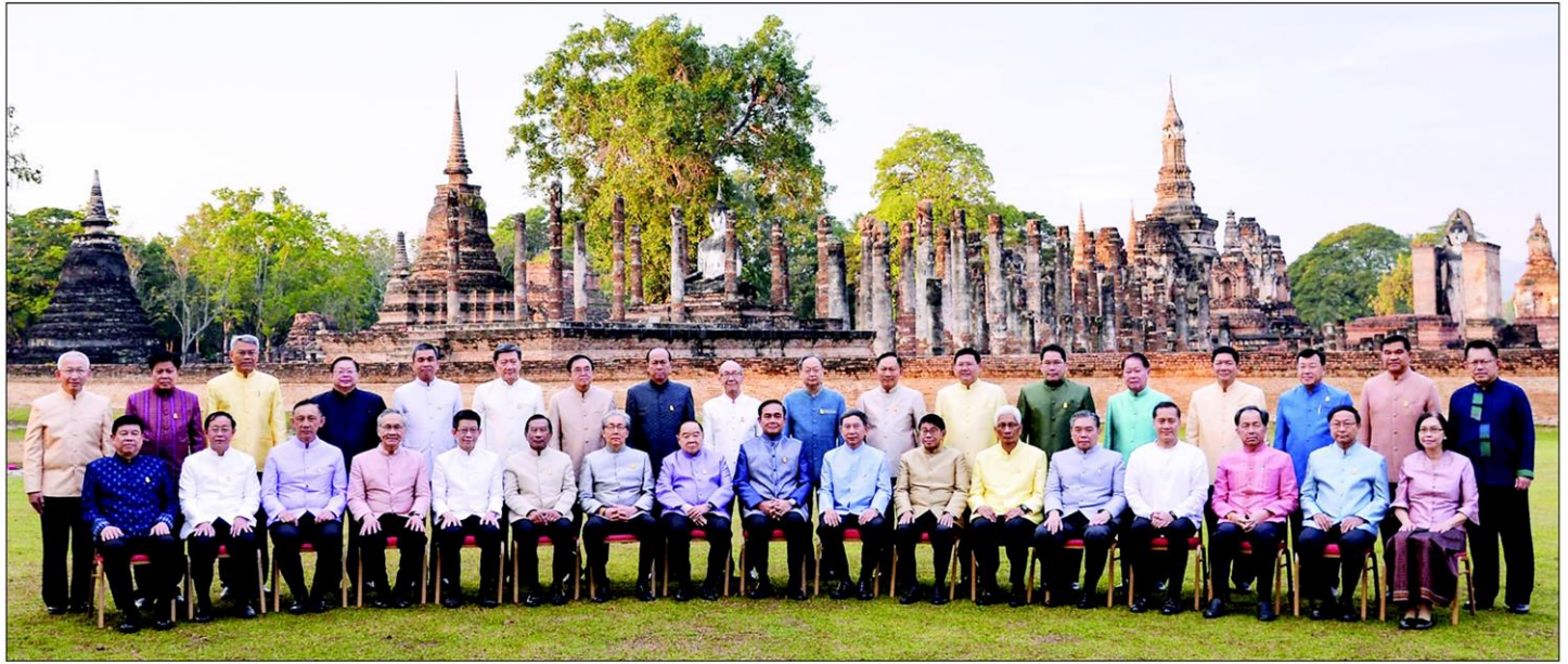
พล.อ.ประยุทธ์ จันทร์โอชา นายกรัฐมนตรี นำทีมคณะรัฐมนตรีประชุม กรม.สัญญา และถ่ายรูปหมู่บริเวณอุทยานประวัติศาสตร์สุโขทัย จ.สุโขทัย