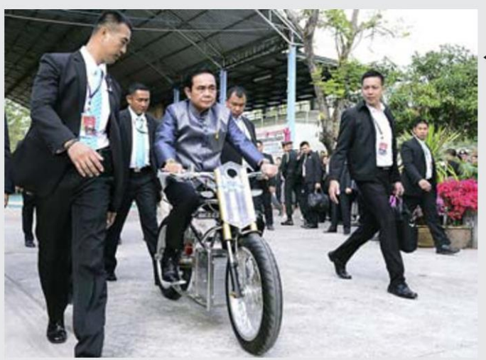
พล.อ.ประยุทธ์ จันทร์โอชา นายกรัฐมนตรี ทดลองขับรถมอเตอร์ไซด์ไฟฟ้าระหว่างเยี่ยมชมนิทรรศการผลงานของวิทยาลัยการอาชีพศรีษะเกษ ที่ได้รับรางวัล สุดยอดนวัตกรรมอาชีพศึกษา สิ่งประดิษฐ์ของคนรุ่นใหม่ ที่นำมาแสดงภายในบริเวณสถาบันการพลศึกษาวิทยาลัยเขตสุโขทัย วานนี้ (26 ธ.ค.)

ผู้สื่อข่าวถามถึงจุดยืนของรัฐบาลต่อการสร้างเขื่อนแก่งเสือเต้น ภายหลัง นายวิวัฒน์ ศัลยกำธร รมช.เกษตรฯ ยืนยันว่าจะไม่สร้าง โดยจะเสนอให้ใช้ “สะเอียบโมเดล” คือ สร้างอ่างเก็บน้ำขนาดเล็ก 4 แห่งแทนนั้น พล.อ.ประยุทธ์ กล่าวว่า เรื่องนี้เป็นเรื่องละเอียดอ่อน สิ่งที่ทำวันนี้ คือ การทำอ่างเก็บน้ำและขยาย