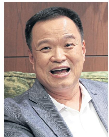
Anutin: Eyeing Pheu Thai defectors

Last month the premier exercised the all-powerful Section 44 at his disposal to address parties' fears about not being able to meet the