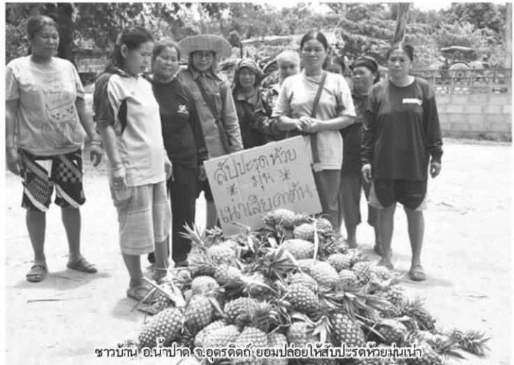
ชาวบ้าน อ.น้ำปาด จ.อุตรดิตถ์ ยอมปล่อยให้สับปะรดห้วยมันเฒ่า

“หากมองถึงสถานการณ์การผลิตสับปะรดปี 2561 (ข้อมูล ณ ธันวาคม 2560) สศก.คาดว่าจะมีเนื้อที่เก็บเกี่ยว 0.581 ล้านไร่ ผลผลิต 2.462 ล้านตัน ผลผลิตต่อไร่ 4,233 กิโลกรัม เพิ่มขึ้นจากปี 2560 ร้อยละ 10.43 ร้อยละ 13.22 และร้อยละ 2.52 ตามลำดับ เนื่องจากช่วงปี 2558-2559 ราคาอยู่ในเกณฑ์ เกษตรกรขยายพื้นที่ปลูกในพื้นที่ไม่เคยปลูกสับปะรดมาก่อน รวมทั้งต้นสับปะรดปีแรกให้ผลผลิตเพิ่มขึ้นผลผลิตออกสู่ตลาดมากตั้งแต่เดือนมีนาคม โดย