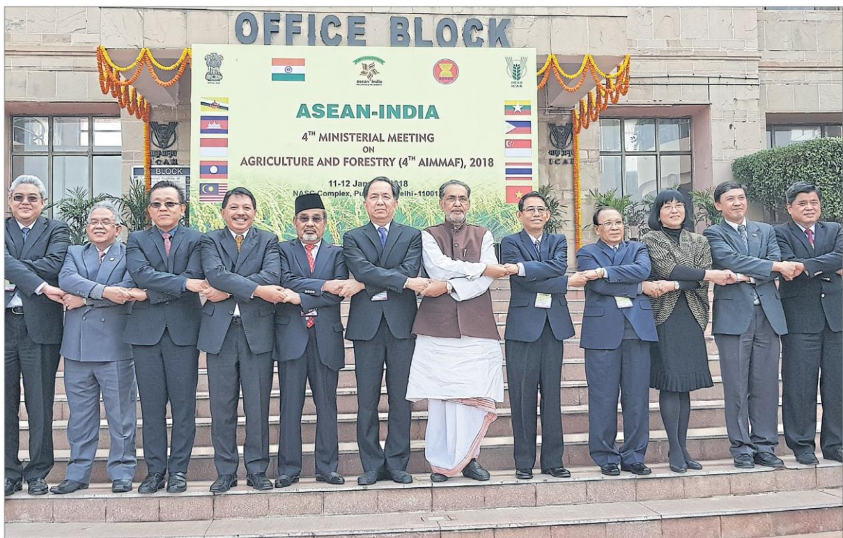
ผนึกแผนเกษตร : ฤทธิชัย บุญราช รัฐมนตรีว่าการกระทรวงเกษตรและสหกรณ์ (ที่ 6 จากซ้าย) เข้าร่วมประชุมรัฐมนตรีอาเซียน-อินเดียด้านการเกษตรและป่าไม้ ครั้งที่ 4 เพื่อแลกเปลี่ยนความคิดเห็น พร้อมถ่ายทอดเทคโนโลยี การวิจัยและพัฒนา จัดทำแผนพัฒนาระหว่างอาเซียนและอินเดียร่วมกัน