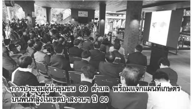
การประชุมผู้นำชุมชน 99 ตำบล พร้อมแจกแผนที่เกษตรบนพื้นที่สูงในเขตป่าสงวนฯ ปี 60

ป ัญหาการสูญเสียพื้นที่ป่าอย่างหนักของจังหวัดน่าน ซึ่งเป็นป่าต้นน้ำที่กลั่นกรองมวลน้ำถึง 40% ของแม่น้ำเจ้าพระยา ได้รับการยกระดับเป็นปัญหาระดับชาติในช่วง 5 ปีที่ผ่านมา ภาพเขาหัวโล้นสร้างความตื่นตัวรักษาป่าให้กับภาคเอกชน สถาบันการศึกษา ตลอดจนโครงการของมูลนิธิปิดทองหลังพระ สืบสานตามแนวพระราชดำริ ได้เข้ามาทำงานขับเคลื่อนเพื่อหยุดยั้งการทำลายป่าต้นน้ำน่านควบคู่กับการฟื้นฟูสภาพป่าให้คืนกลับมาใหม่