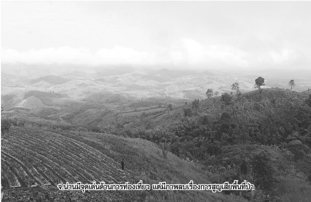
จะงานมีจุดเด่นด้านกรท่องเที่ยว แต่มีภาพลบเรื่องการสูญเสียพื้นที่ป่า

กลิกรนำเสนอมอดลให้ฟังว่า เป็นการจัตสรรที่ดินป่าสงวนจังหวัดน่าน ใน 99 ตำบล โดย 72% ยังเป็นป่าที่มีต้นไม้ใหญ่อยู่ 18% ต้องฟื้นฟูกลับมาเป็นป่าที่มีต้นไม้ใหญ่ แต่อนุญาตให้ปลูกพืชเศรษฐกิจได้ต้นไม้ใหญ่ได้ และอีก 10% ยอมให้ปลูกพืชเศรษฐกิจเต็มที แต่ยังคงเป็นพื้นที่ป่าสงวนฯ โดยกฎหมาย