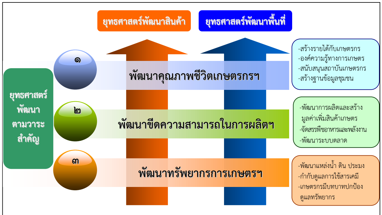
ภาพที่ ๑ การแปลงแผนไปสู่การปฏิบัติในเชิงยุทธศาสตร์พัฒนาสินค้า (Commodity - Based) เชิงยุทธศาสตร์พัฒนาพื้นที่ (Area - Based) และเชิงยุทธศาสตร์พัฒนาตามวาระสำคัญ (Agenda - Based)

(๒) การแปลงแผนพัฒนาการเกษตร ในช่วงแผนพัฒนาฯ ฉบับที่ ๑๑ สู่แผนปฏิบัติราชการ ๔ ปี และแผนปฏิบัติราชการประจำปีของกระทรวงและกรม โดยนำแผนงานการพัฒนาประเด็นสำคัญในแผนพัฒนาฯ ฉบับที่ ๑๑ จากทั้ง ๓ ยุทธศาสตร์เป็นกรอบในการจัดทำยุทธศาสตร์กระทรวงที่เป็นไปในทิศทางเดียวกับแผนการบริหารราชการแผ่นดิน สำหรับเสนอของบประมาณสนับสนุนในระยะเวลา ๔ ปี และแปลงสู่แผนปฏิบัติราชการประจำปี โดยพิจารณาความสอดคล้องของยุทธศาสตร์พัฒนาสินค้า ยุทธศาสตร์พัฒนาพื้นที่ ตลอดจนให้ความสำคัญกับการนำผลงานวิจัยด้านวิทยาศาสตร์และเทคโนโลยีมาปรับใช้เพื่อเพิ่มประสิทธิภาพการดำเนินงาน