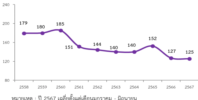
ราคาที่เกษตรกรขายได้ กุ้งขาวแวนนาไม ขนาด 70 ตัว/กก. (บาท/กก.)

แหล่งผลิต 5 อันดับแรก ได้แก่ 1.จ.ฉะเชิงเทรา 2.จ.ปราจีนบุรี 3.จ.สุราษฎร์ธานี 4.จ.สมุทรปราการ 5.จ.นครศรีธรรมราช