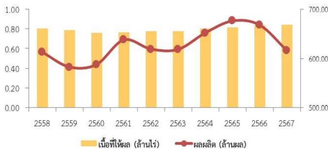
เนื้อที่ให้ผลและผลผลิต มะพร้าวผลแก่

แหล่งผลิต 5 อันดับแรก ได้แก่ 1. จ.ประจวบคีรีขันธ์ 2. จ.ชุมพร 3. จ.สุราษฎร์ธานี 4. จ.นครศรีธรรมราช 5. จ.สมุทรสงคราม