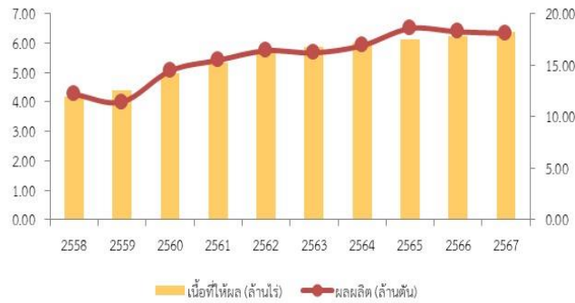
เนื้อที่ให้ผลและผลผลิต ปาล์มน้ำมัน

แหล่งผลิต 5 อันดับแรก ได้แก่ 1.จ.สุราษฎร์ธานี 2.จ.กระบี่ 3.จ.ชุมพร 4.จ.นครศรีธรรมราช 5.จ.ตรัง