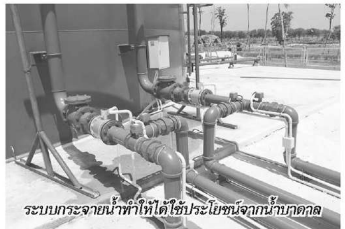
ระบบกระจายน้ำทำให้ได้ใช้ประโยชน์จากน้ำบาดาล