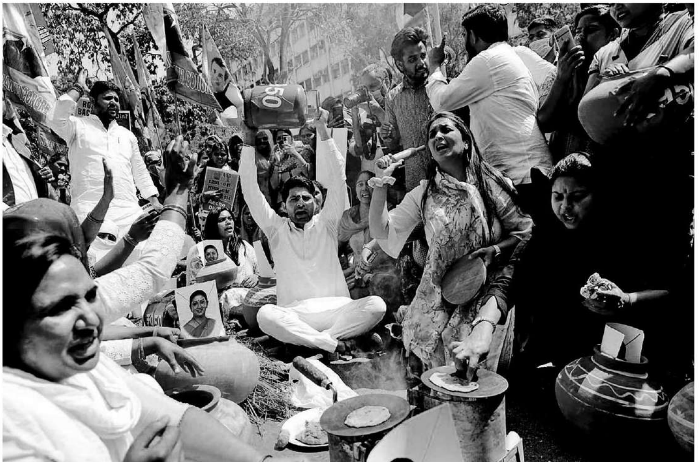
การประท้วงอาหารราคาน้ำมันแพงในอินเดีย

ราคาเชื้อเพลิงที่เพิ่มสูงขึ้นเป็นหนึ่งในผลจากสงครามระหว่างรัสเซียและยูเครนในขณะนี้ หากมองย้อนไปเมื่อวันที่ 23 กุมภาพันธ์ หนึ่งในวันก่อนหน้าการบุกเข้าโจมตียูเครนของรัสเซีย จะพบว่า ราคาน้ำมันดิบเวสต์เท็กซัสจะอยู่ที่ 92.10 ดอลลาร์สหรัฐต่อบาร์เรลเท่านั้น ก่อนที่จะพุ่งขึ้นไปแตะ 119.40 ดอลลาร์สหรัฐต่อบาร์เรลในวันที่ 7 มีนาคม ซึ่งเป็นราคาสูงสุดในรอบปี อย่างไรก็ตาม ราคาน้ำมันดิบเมื่อวันที่ 24 กุมภาพันธ์ อาจดูไม่ได้แตกต่างมากเมื่อเทียบกับราคาน้ำมันดิบเวสต์เท็กซัส ล่าสุดในวันที่ 8 เมษายน ซึ่งอยู่ที่ 97.22 ดอลลาร์สหรัฐต่อบาร์เรล ซึ่งทยอยลดลงอย่างต่อเนื่องหลังจากสหรัฐอเมริกาประกาศว่า จะปล่อยน้ำมันสำรองจากคลังสำรองน้ำมันเชิงยุทธศาสตร์วันละ 1 ล้านบาร์เรล ติดต่อกันเป็นเวลา 6 เดือน นับตั้งแต่เดือน