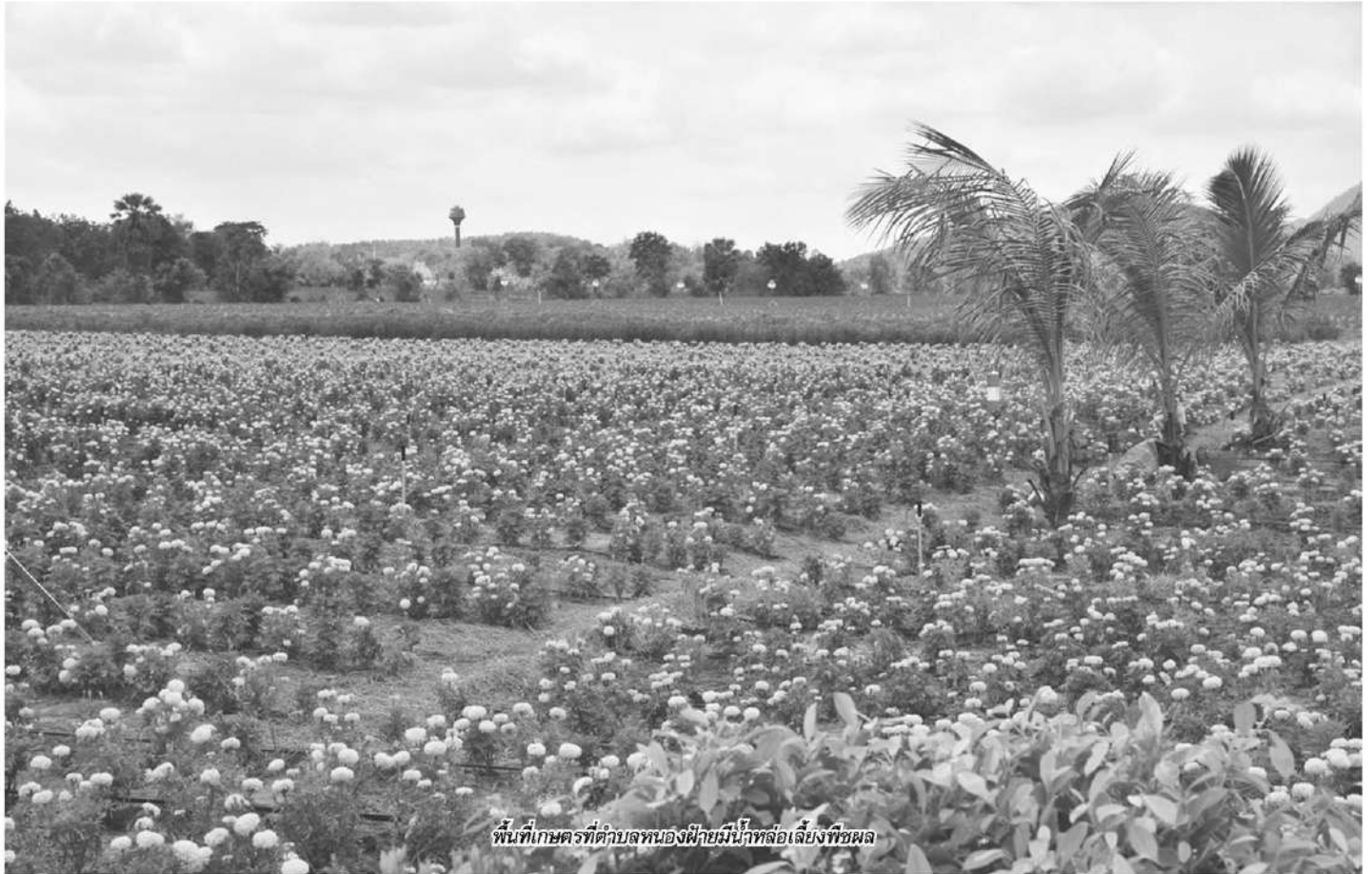
พื้นที่เกษตรที่คอกบของพี่ชายมีน้ำที่หล่อเลี้ยงพืชผล

ซึ่งประชาชนจะได้รับประโยชน์ไม่น้อยกว่า 11,600 ครัวเรือน หรือ 58,000 คน พื้นที่ได้รับประโยชน์กว่า 300,000 ไร่ ปริมาณน้ำรวม 2.3 ล้าน ลบ.ม.ต่อปี