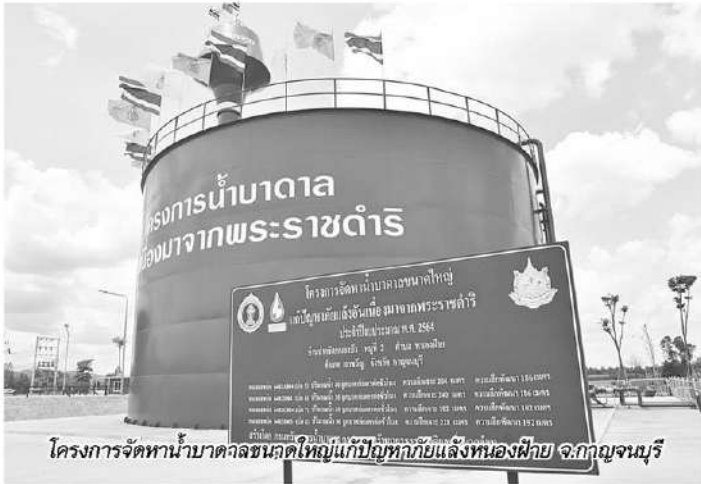
โครงการจัดหาน้ำบาดาลขนาดใหญ่แก้ปัญหาภัยแล้งของฝาย จ.กาญจนบุรี