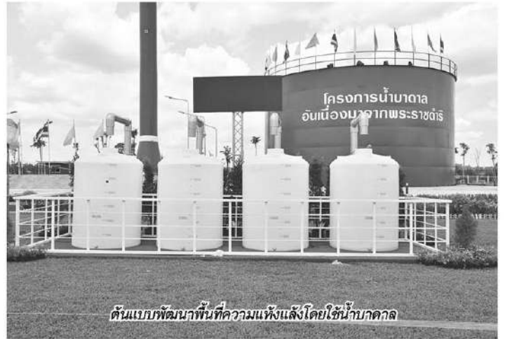
ต้นแบบพัฒนาพื้นที่ความแห้งแล้งโดยใช้น้ำบาดาล

อ เภอเลขาขวัญ ติดอันดับ 1 ใน 5 อำเภอของ จ.กาญจนบุรี ที่ได้รับสมญานามว่าเป็น “อีสานภาคกลาง” อีก 4 อำเภอ ประกอบด้วย ห้วยกระเจา หนองปรือ ปอพลอย และพนมทวน ที่มาของชื่อเพราะพื้นที่ดังกล่าวมีอากาศร้อนและแห้งแล้ง ตั้งอยู่บริเวณเขตเงาฝนของเทือกเขาตะนาวศรี ทำให้แต่ละปีมีปริมาณฝนตกไม่ถึง 1,000 มิลลิเมตร ซึ่งเฉลี่ยต่ำกว่าพื้นที่ทั่วไปของประเทศไทยที่มีปริมาณฝนเฉลี่ยอยู่ที่ 1,467 มิลลิเมตรต่อปี ประกอบกับลักษณะดิน เป็นดินร่วนปนทรายทำให้ไม่อุ้มน้ำ