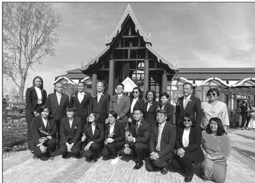
ร่วมงาน : ดร.ทองเปลว กองจันทร์ ปลัดกระทรวงเกษตรและสหกรณ์ เป็นประธานพิธีเปิด Thailand Pavilion ที่ประเทศเนเธอร์แลนด์ ซึ่งไทยได้ร่วมงานมหกรรมพืชสวนโลก 2022 เพื่อโซว์ศักยภาพด้านเกษตร

“นับเป็นโอกาสอันดีในการกระชับความสัมพันธ์ระหว่างประเทศ ทั้งกับเจ้าภาพและประเทศภาคีสมาชิกที่ร่วมงาน และยังเป็นการประชาสัมพันธ์ภาพลักษณ์ของประเทศไทย ผ่านการนำเสนอการ