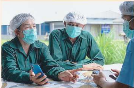
โลกอย่างยั่งยืน"

"เราให้ความสำคัญกับระบบการผลิตอาหารที่เป็นมิตรต่อสิ่งแวดล้อม โดยเฉพาะการลดปล่อยก๊าซเรือนกระจกในกระบวนการผลิตตั้งแต่ต้นน้ำจนถึงปลายน้ำด้วยการนำหลักเศรษฐกิจชีวภาพ เศรษฐกิจหมุนเวียน และเศรษฐกิจสีเขียว หรือ BCG Model มาใช้บริหารจัดการธุรกิจส่งเสริม 21 ปีที่แล้ว ด้วยการนำการใช้พลังงานหมุนเวียนในฟาร์มสุกร โดยนำระบบไบโอแก๊สมาเปลี่ยนมูลสัตว์เป็นพลังงานทดแทน ที่เรานำร่องดำเนินการมาตั้งแต่ปี 2544 และถ่ายทอดความรู้ให้กับเกษตรกรในโครงการส่งเสริมอาชีพการเลี้ยงสุกรรายย่อยหรือคอนแทรคฟาร์มมิ่งเพื่อร่วมกันผลักดันภาคปศุสัตว์มีส่วนร่วมในการลดภาวะโลกร้อนให้กับ