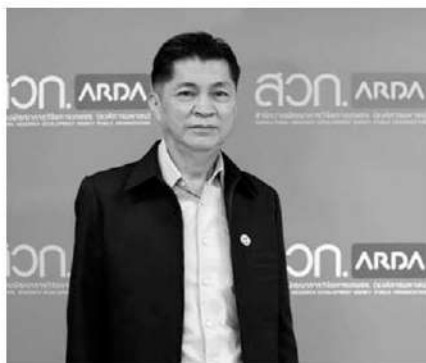
ดร.สุวิทย์ ชัยเกียรติยศ

ผู้จัดการรายวัน360° – สำนักงานพัฒนาการวิจัยการเกษตร (องค์การมหาชน) เดินหน้าขับเคลื่อนนโยบาย เพื่อเพิ่มมูลค่าสินค้าเกษตรและอาหารของประเทศ ด้วย FFC Thailand หรือ Foods with Function Claims ระบบทางเลือกของการรับรองการกล่าวอ้างเชิงหน้าที่ด้วยตนเองในสินค้าเกษตร และผลิตภัณฑ์อาหารแปรรูป เพื่อก้าวไปสู่บทบาทหนึ่งในผู้ผลิตอาหารในตลาดโลก ดร.สุวิทย์ ชัยเกียรติยศ ผู้อำนวยการสำนักงานพัฒนาการวิจัยการเกษตร (องค์การมหาชน) หรือ สวก. กล่าวถึงความสำคัญของ FFC Thailand และแนวทางการขับเคลื่อนรวมทั้งการรับรอง FFC และประโยชน์ที่จะได้รับว่า “FFC Thailand หรือ Foods with Function Claims คือ ระบบการรับรองปริมาณสารสำคัญ ที่ส่งผลดีต่อสุขภาพ ซึ่งจะเป็นระบบการรับรองได้ทั้งในผลผลิตทางการเกษตรและผลิตภัณฑ์อาหารแปรรูป ถ้าจะให้อธิบาย