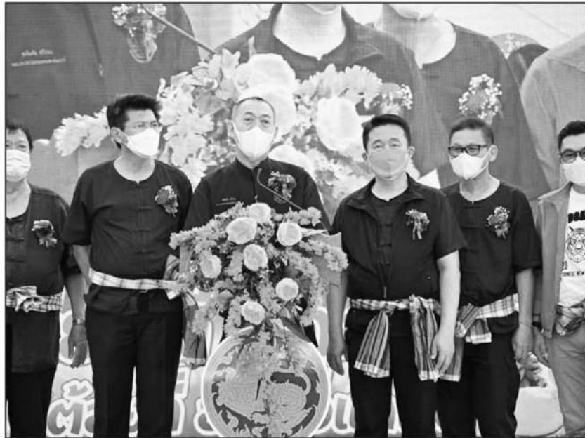
ชมนงาน : ดร.เฉลิมชัย ศรีอ่อน รว.เกษตรและสหกรณ์ ชมนงานเทศกาลผลไม้และของดี อ.แกลง จ.ระยอง เน้นเพิ่มศักยภาพการจำหน่ายผลไม้คุณภาพ และของดีใน อ.แกลง โดยผลิตภัณฑ์ออกสู่ตลาดต่างประเทศ