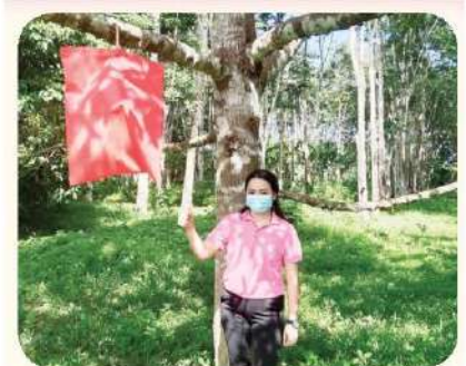
กลุ่มอารักขาพืช สำนักงานเกษตรจังหวัด ตรัง”.