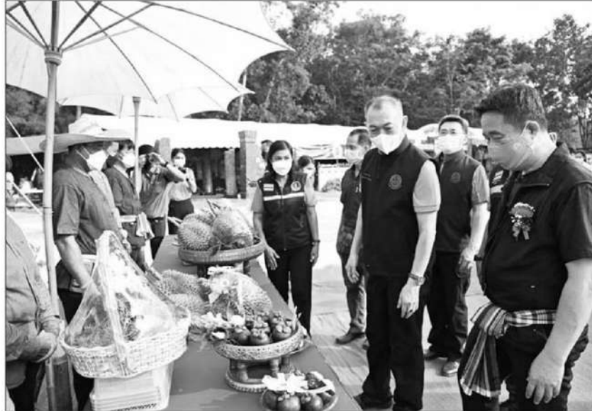
ผลักดัน : ดร.เฉลิมชัย ศรีอ่อน รว.เกษตรและสหกรณ์ ร่วมงาน “ทุเรียนเขาชะเมา เล้าขานเมืองสามอ่าง” มุ่งผลักดันทุเรียนเขาชะเมา ที่มีมาตรฐานสูง คุณภาพดี เพื่อส่งเสริมภาคการเกษตร อุตสาหกรรมและท่องเที่ยว