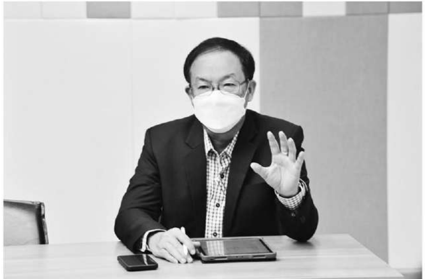
นายอชฌา สุวรรณนิตย์ รองอธิบดีกรมส่งเสริมสหกรณ์

“เกษตรกรที่ปรับจากการปลูกข้าวนาปรังมาปลูกข้าวโพดหลังนา แม้จะไม่มาก หากเปรียบเทียบกับความต้องการในประเทศที่มีประมาณ 8 ล้านตัน ประเทศไทยผลิตได้เพียง 4-5 ล้านตัน ทำให้ข้าวโพดฤดูแล้งสามารถทำรายได้ที่ดีเปรียบเทียบกับต่อไร่ระหว่างข้าวกับข้าวโพด อย่างไรก็ตาม