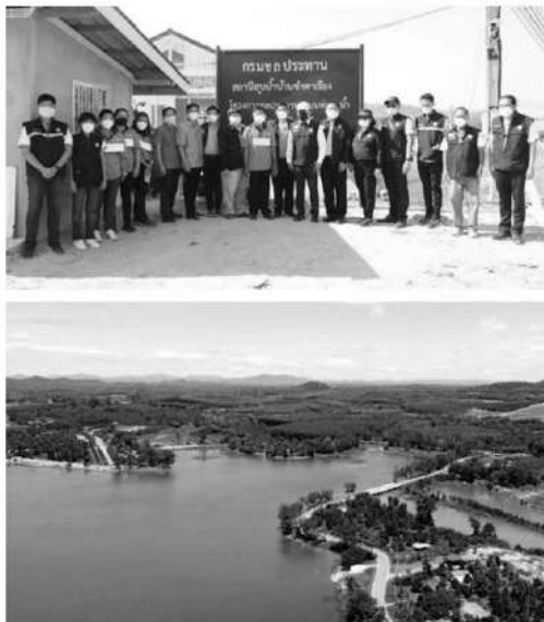
กลุ่มบริหารการใช้ระบบท่อส่งน้ำบ้านชำตาเรือ เป็นกลุ่มผู้ใช้น้ำจากอ่างเก็บน้ำศาลทราย ต.คลองพลู อ.เขาฉกรรจ์ จ.จันทบุรี

ทั้งนี้ในการดำเนินการคัดเลือกสถาบันเกษตรกรผู้ใช้น้ำชลประทานดีเด่น เป็นไปตามนโยบายของกรมชลประทานที่ต้องการส่งเสริมการมีส่วนร่วมของเกษตรกรกลุ่มผู้ใช้น้ำ เพื่อเพิ่มประสิทธิภาพการบริหารจัดการน้ำ ให้มีปริมาณน้ำเพียงพอต่อการเกษตรอย่างทั่วถึงและเป็นธรรม โดยเกณฑ์ในการคัดเลือกกระทรวงเกษตรและสหกรณ์กำหนดไว้ 5 ด้านหลักๆ คือ 1.ความคิดริเริ่ม 2.ความสามารถในการบริหารและจัดการสถาบัน 3.บทบาทและการมีส่วนร่วมของสมาชิกต่อสถาบัน 4.ความมั่นคงและฐานะทางเศรษฐกิจของสถาบัน และ 5.การทำกิจกรรมด้านสาธารณประโยชน์และการอนุรักษ์ทรัพยากรธรรมชาติและสิ่งแวดล้อม