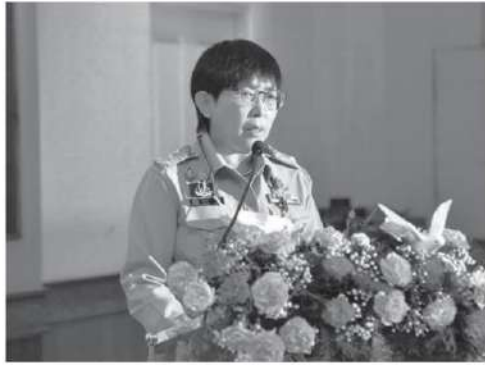
นางสาวเบญจพร ชาครานนท์ อธิบดีกรมพัฒนาที่ดิน

บทบาทสำคัญตั้งแต่การวางแผนกำหนดพื้นที่ที่เหมาะสมในการปลูกพืชเศรษฐกิจที่สำคัญของประเทศ การสนับสนุนส่งเสริมการพัฒนาที่ดินด้วยระบบอนุรักษ์ดินและน้ำ การจัดการดินและปุ๋ย