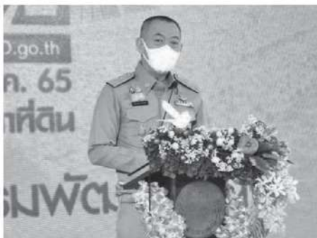
ดร.เฉลิมชัย ศรีอ่อน รัฐมนตรีว่าการกระทรวงเกษตรและสหกรณ์

กรมพัฒนาที่ดิน ครบรอบ 59 ปี โขววิสัยทัศน์ ภายใต้หัวข้อ “ทิมดี ดินดี 59 ปี กรมพัฒนาที่ดิน” เผยผลงานที่ตอบสนองนโยบายของรัฐบาล และความต้องการของประชาชนที่สอดคล้องกับแผนยุทธศาสตร์และแผนพัฒนาระดับต่างๆ เพื่อให้เกษตรกรใช้ประโยชน์ที่ดินได้อย่างเหมาะสม สร้างความมั่นคงทางอาหาร และรักษาสมดุลของระบบนิเวศ ดิน น้ำ ป่าไม้ไปพร้อมกัน