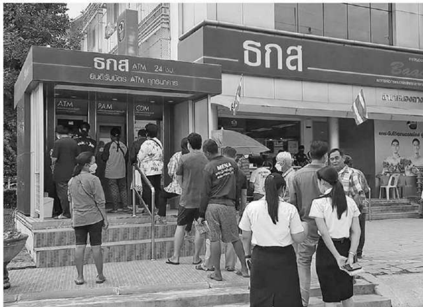
เช็กยอดเงิน - ชาวนาใน จ.อุทัยธานี เข้าคิวรอเพื่อเช็กยอดเงินและบางส่วนกดเงินสดออกมา หลังรัฐบาล โอนค่าประกันรายได้เกษตรกรผู้ปลูกข้าวและค่าเกี่ยวข้าวอีกไร่ละ 1 พันบาท ต่างรู้สึกพอใจที่เงินช่วยเหลือ โอนเข้าแล้ว ที่ ธ.ก.ส.หนองฉาง จ.อุทัยธานี เมื่อวันที่ 25 พฤศจิกายน