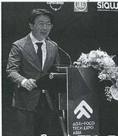
บรรยายภาคภายในงาน Ag-Volution For The Future

ในภูมิภาคเอเชียจะได้พบนวัตกรรมและ ความรู้ต่อยอดอุตสาหกรรม เกษตร- อาหารเติบโตอย่างยั่งยืน อย่างไรก็ตาม มั่นใจตลอด 3 วันของการจัดงานมีผู้เข้า ร่วมงานจากนานาชาติประมาณ 6,000 ราย และสำหรับผู้สนใจติดตามข้อมูล เพิ่มเติมเกี่ยวกับ Agri-Food Tech Expo Asia ได้ที่ agrifoodtechexpo.com