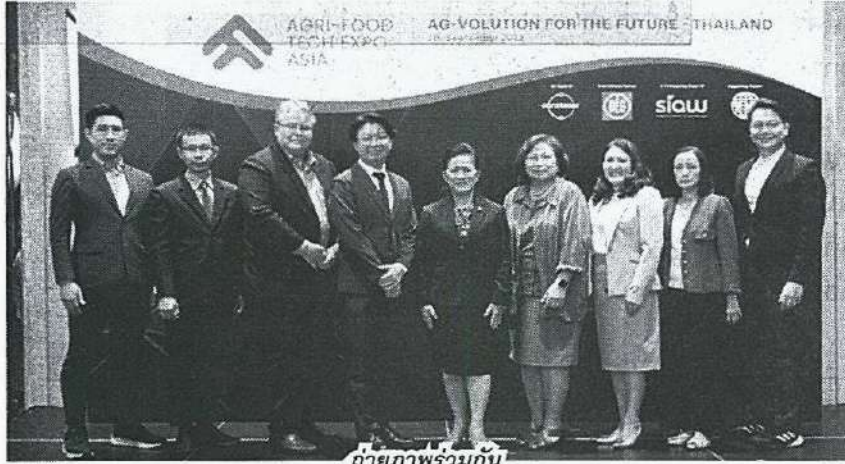
ถ่ายภาพร่วมกัน