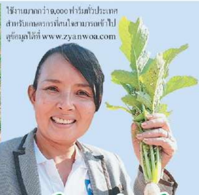
ใช้งานมากกว่า 9,000 ฟาร์มทั่วประเทศ สำหรับเกษตรกรที่สนใจสามารถเข้าไปดูข้อมูลได้ที่ www.zyanwoa.com