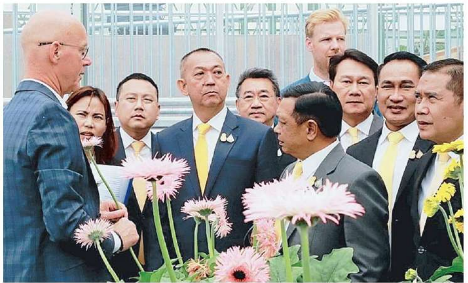
สู่สายตาโลก นายเฉลิมชัย ศรีอ่อน รว.เกษตรฯ เปิดกิจกรรม Thailand National Day ในงาน EXPO 2022 Floriade Almere จัดขึ้นที่ประเทศเนเธอร์แลนด์ เพื่อเทิดพระเกียรติในหลวง พร้อมโชว์ศักยภาพพืชสวนไทยสู่ประชาคมโลก.