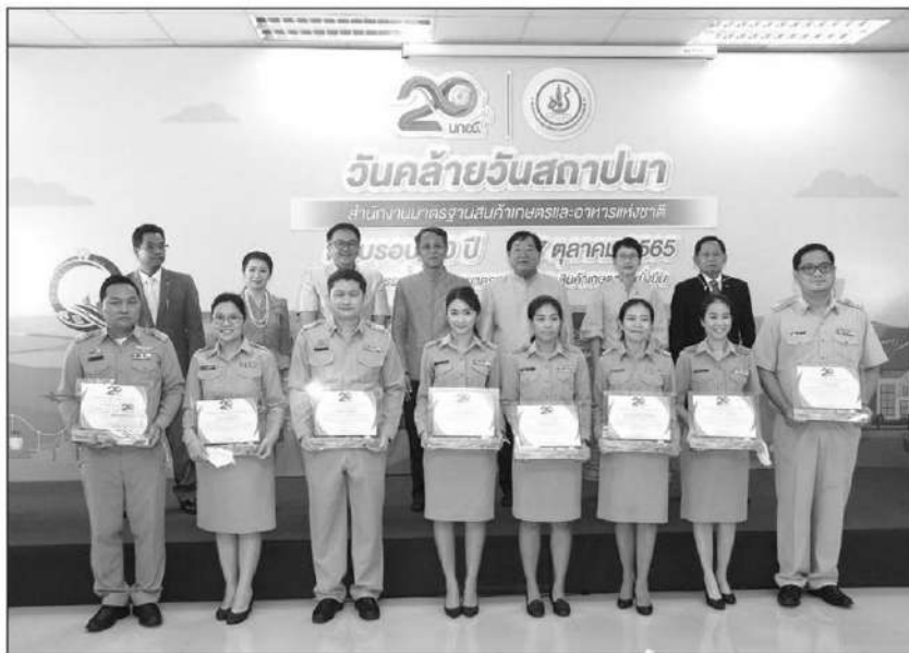
20 ปี มกอช. : นายประภัตร โพธสุธน รัฐมนตรีและสหกรณ์ ร่วมงานวันคล้ายวันสถาปนาสำนักงานมาตรฐานสินค้าเกษตรและอาหารแห่งชาติ (มกอช.) ครบรอบ 20 ปี โดยมอบนโยบายการปฏิบัติงานและสร้างขวัญกำลังใจแก่เจ้าหน้าที่ผู้ปฏิบัติงาน

ทั้งนี้ ภายในงานยังมีการมอบโล่และใบประกาศเกียรติคุณ ให้กับเจ้าหน้าที่ของสำนักงานมาตรฐานสินค้าเกษตรและอาหารแห่งชาติ มกอช. ที่ดีเด่นประเภทต่างๆ 35 รางวัล ให้กับผู้รับบริการจากมกอช. 92 รางวัล ได้แก่ 1.ประเภทตรวจสอบรับรองด้านสินค้าเกษตรและอาหาร 6 รางวัล 2.ประเภทสถานที่จำหน่ายสินค้าเกษตรปลอดภัยได้มาตรฐาน 72 รางวัล และ 3.สำนักงานเกษตรและสหกรณ์จังหวัดดีเด่น 12 รางวัล มีการจัดนิทรรศการย้อนรำลึก 2 ทศวรรษ มกอช. “ACFS 20 th Anniversary: the journey of agricultural standards” และก้าวสู่อนาคตกับการขับเคลื่อนงานตลอดห่วงโซ่คุณค่า (Value Chain) และเปิดตัวกิจกรรม เดิน-วิ่งเพื่อการกุศล (ACFS RUN FOR Q VIRTUAL RUN 2022) โดยมีกิจกรรมถึงวันที่ 30 พฤศจิกายน นี้