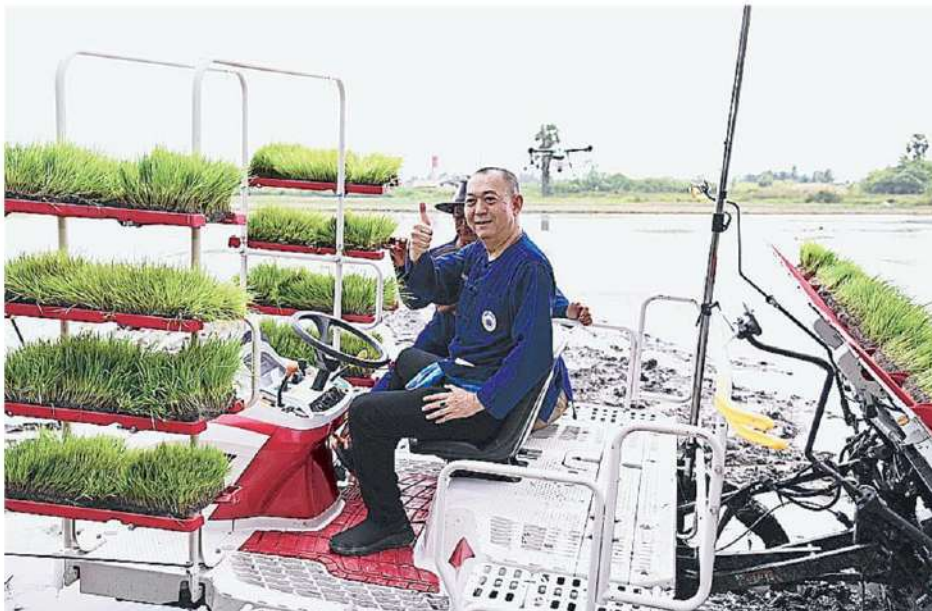
นาแปลงใหญ่ นายเฉลิมชัย ศรีอ่อน รมว.เกษตรและสหกรณ์ นั่งรดน้ำระหว่างเปิดงานการจัดงานถ่ายทอดเทคโนโลยีเพิ่มประสิทธิภาพการผลิตข้าว โครงการระบบส่งเสริมเกษตรแบบแปลงใหญ่ที่ อบต.หัวไทร อ.หัวไทร จ.นครศรีธรรมราช.

"การจัดงานครั้งนี้มีส่วนกระตุ้นและสร้างแรงจูงใจให้สมาชิกของกลุ่มนาแปลงใหญ่ ศูนย์ข้าวชุมชน และเกษตรกรผู้ปลูกข้าวที่เข้าร่วมงานได้รับรู้และเข้าใจการนำเทคโนโลยีการเกษตรสมัยใหม่มาใช้เพื่อลดต้นทุนการผลิตข้าวที่เหมาะสม อย่างไรก็ตามกระทรวงเกษตรฯ ไม่ทอดทิ้งเกษตรกรรายย่อยพร้อมขับเคลื่อนการดำเนินงานเพื่อช่วยเหลือพี่น้องเกษตรกรด้วยกัน เพื่อให้พี่น้องเกษตรกรได้รับประโยชน์อย่างแท้จริง หากเกษตรกรมั่นคงและมั่งคั่งจะทำให้เศรษฐกิจหมุนเวียนและประเทศชาติมั่นคงตามไปด้วย" นายเฉลิมชัยกล่าว