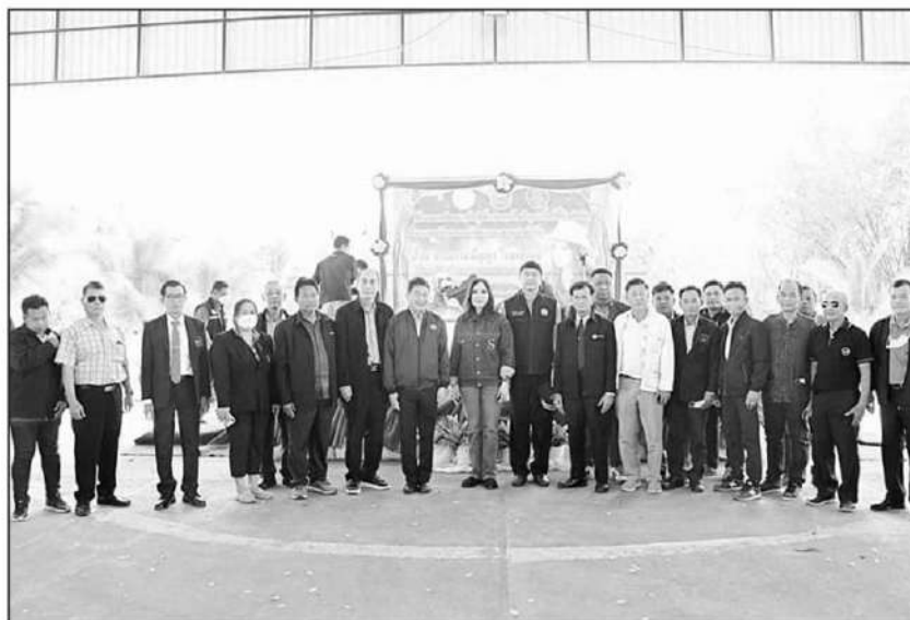
แก้ปัญหา : น.ส.มัญญา ไทยเศรษฐ์ รัฐมนตรีและสหกรณ์ ลงพื้นที่แก้ปัญหาที่ดินทำกินของสมาชิกสหกรณ์นิคมบางสะพาน จำกัด ที่เรื้อรังมากกว่า 40 ปี โดยหารือร่วมกับหน่วยงานที่เกี่ยวข้อง เร่งรัดดำเนินการเสนอคณะกรรมการนโยบายที่ดินแห่งชาติ (คทช.) พิจารณา

ทั้งนี้ เครือข่ายสหกรณ์ 13 นิคม 14 ป่า ไม่ประสงค์เข้าสู่โครงการการจัดที่ดินทำกินให้ชุมชนตามนโยบายรัฐบาล (คทช.) เนื่องจากพื้นที่ดังกล่าวไม่ได้เป็นพื้นที่ป่า แต่เป็นชุมชนมีสิ่ง