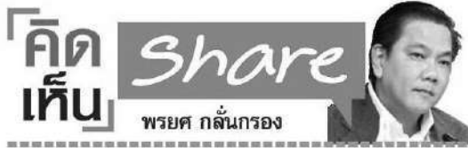
รองอธิบดีกรมโรงงานอุตสาหกรรม (กรอ.)

ส วัสดีครับท่านผู้อ่านคอลัมน์คิด เห็น แชร์ และผู้อ่านมติชนทุกท่าน