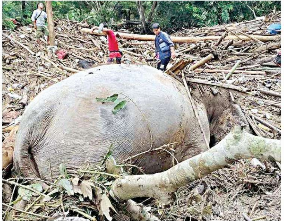
▲ เหยื่อน้ำป่า... น้ำป่าไหลหลากท่วมศูนย์บริบาลช้าง มูลนิธิอนุรักษ์ช้างและสิ่งแวดล้อม ต.กัตช้าง อ.แม่แตง จ.เชียงใหม่ ที่มีช้างอยู่ 126 เชือก เจ้าหน้าที่ระดมช่วยเหลือสลัดมีช้างถูกน้ำซัดล้ม 2 เชือก

เชื่อนเจ้าพระยาเร่งระบายน้ำ ปภ. ประสาน 10 จังหวัดภาคกลาง รวมกวม. เฝ้าระวังระดับน้ำสูงขึ้น สั่งเตรียมยกของขึ้นที่สูงด่วน ◆ อ่านต่อหน้า 14