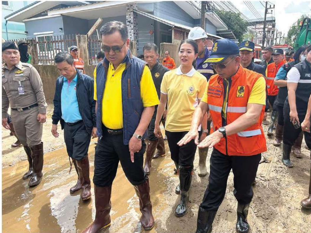
ให้กำลังใจ - นายอนุทิน ชาญวีรกูล รองนายกรัฐมนตรีและ รมว.มหาดไทย น.ส.ธีรรัตน์ สำเร็จวานิชย์ รมช.มหาดไทย และคณะ เดินทางตรวจเยี่ยมและให้กำลังใจชาวบ้านและอาสาสมัครรักษาดินแดน ที่ไปปฏิบัติหน้าที่ช่วยเหลือประชาชน ในพื้นที่ชุมชนเกาะทราย อ.แม่สาย จ.เชียงราย เคลียร์ดินโคลนหลังน้ำลด เมื่อวันที่ 5 ตุลาคม

หัวข้อข่าว: จมทั้งเมือง-ระดมทุกหน่วยช่วย 'อึ้งค์' หวังเชียงใหม่