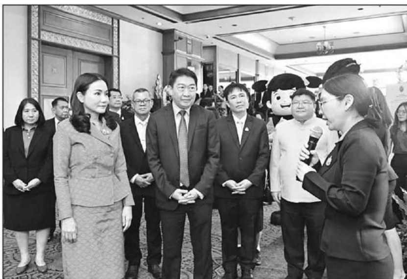
ครบ 52 ปี : ศ.ดร.นฤมล ภิญโญสินวัฒน์ รว.เกษตรและสหกรณ์ ร่วมงานสัมมนาทางวิชาการเนื่องในโอกาสวันสถาปนากกรมส่งเสริมสหกรณ์ ประจำปี 2567 ครอบรอบ 52 ปี ที่โรงแรมปรีณซ์พาเลซ กทม. โดยมุ่งผลักดันนโยบายสหกรณ์ภาคการเกษตร เพิ่มรายได้ให้สมาชิกสหกรณ์ สร้างกลุ่มอาชีพเพื่อสร้างรายได้

ผลิตให้ได้ปริมาณต่อไร่เพิ่มขึ้น พร้อมทั้งส่งเสริมการลดต้นทุนการผลิต และเพิ่มคุณภาพผลผลิตทั้งในด้านคุณภาพและความปลอดภัยให้เป็นที่ยอมรับของตลาด จึงถือเป็นการเปลี่ยนแปลงจากยุค Farmer Aging Society สู่ยุคของ Smart Farmer ได้อย่างสมบูรณ์แบบ รวมทั้งมีการส่งเสริมและพัฒนาร้านค้าสหกรณ์ให้เป็นจุดจำหน่ายสินค้าเกษตรทั้งทางตรงและช่องทางออนไลน์ให้มีความเข้มแข็ง โดยให้สมาชิกสหกรณ์เข้ามามีส่วนร่วมในการใช้บริการของสหกรณ์มากขึ้น พร้อมทั้งผลักดันการเชื่อมโยงเครือข่ายร่วมกันระหว่างสหกรณ์ภาคการเกษตรและสหกรณ์นอกภาคการเกษตรให้มากยิ่งขึ้น