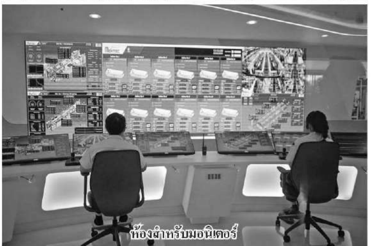
ห้องสำหรับมอนิเตอร์