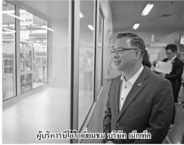
ผู้บริหารบีโอไอเยี่ยมชม บริษัท ผนึกเท็ค

ตัวเลขดังกล่าวสะท้อนว่าอุตสาหกรรมเซมิคอนดักเตอร์มีการลงทุนเพิ่มขึ้นอย่างมีนัยสำคัญ ซึ่งที่ผ่านมามหาบทบาทของไทยอยู่ในขั้นกลางน้ำ คือ การรับจ้างประกอบและทดสอบเซมิคอนดักเตอร์