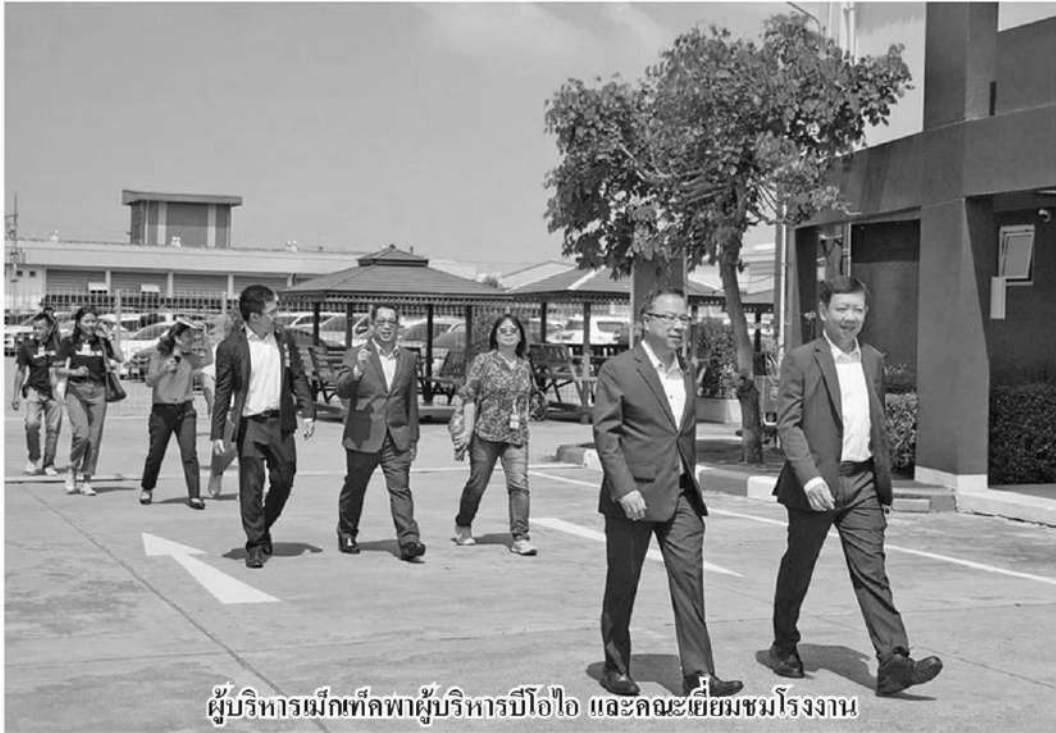
ผู้บริหารเม็กเทลพาผู้บริหารบีโอไอ และคณะเยี่ยมชมโรงงาน

หัวข้อข่าว: รายงานพิเศษ: บีโอไอมั่นใจฝ่าด่าน 3G ฉลุย ซูประเทศไทยหมดหมดยุทธการการผลิต