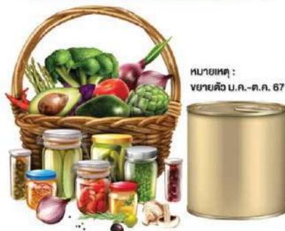
หมายเหตุ: ขยายตัว ม.ค.-ต.ค. 67