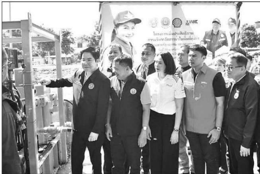
จัดการน้ำ : นายอัครา พรหมเผ่า รมช.เกษตรและสหกรณ์ ร่วม Kick Off โครงการเพิ่มประสิทธิภาพการบริหารจัดการน้ำในพื้นที่ลุ่มต่ำโดยภาครัฐเอกชน และเกษตรกร ที่ประตูเรือสัญจรเจ้าเจ็ด ต.รางจระเข้ อ.เสนา จ.พระนครศรีอยุธยา เพื่อเพิ่มประสิทธิภาพการระบายน้ำพื้นที่ลุ่มต่ำเจ้าพระยา ช่วยแก้ปัญหาพื้นที่ท่วม