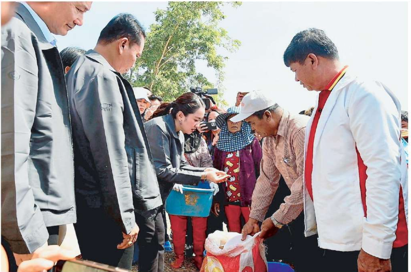
▲ ผู้จัดการน้ำ น.ส.แพทองธาร ชินวัตร นายกรัฐมนตรี สอบถามข้อมูลจากเกษตรกรและเจ้าหน้าที่กรมชลประทาน ขณะนำคณะลงพื้นที่ตรวจประตูระบายน้ำห้วยน้ำเค็ม (DM) ต.ยางท่าแจ้ง อ.โกสุมพิสัย จ.มหาสารคาม ติดตามการแก้ไขปัญหาอุทกภัยลุ่มน้ำชี และการบริหารจัดการน้ำ.

น.ส.แพทองธารกล่าวว่า สำหรับคนที่เรียนกลางๆหรือเด็กหลังห้อง ขอให้ยกมือเราพวกเดียวกัน ไม่ทิ้งอุปเท่ห์เหมือนกัน คนไม่ใช่เด็กเรียนเก่ง เรียนกลางๆ ไม่ได้เรียนร้อยเท่าไร เราเข้าใจอยากให้ทุนการศึกษาถึงน้องๆทุกคนแต่เด็กที่เรียนกลางๆเราจะตัดโอกาสนี้เลยหรือ อยากให้น้องๆมีโอกาสไปเรียนต่างประเทศเรียนสั้นๆหรือ Summer Camp ช่วงปิดเทอมใหญ่ อยากให้น้องๆที่ไม่ได้เรียนถึงขั้นที่อุปแต่มี passion ความหลงใหลและความเข้าใจ จากนั้นได้เดินทักทายถ่ายรูปพร้อมกับเด็กนักเรียน นิสิต นักศึกษาอย่างเป็นกันเอง ท่ามกลางเสียงกรี๊ดเด็กๆมารุมถ่ายเซลที่ด้วยความตื่นเต้นสีใจที่ได้เจอนายกฯ