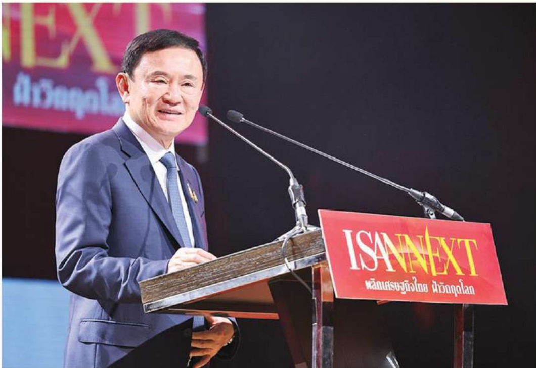
🏠 โอกาสประเทศไทย - นายทักซิณ ชินวัตร อดีตนายกกฯ บรรยายพิเศษ ‘อนาคตอีสาน โอกาสประเทศไทย’ ในงาน สัมมนา ISAN NEXT : พลิกเศรษฐกิจไทย ฝ่าวิกฤตโลก ที่มหาวิทยาลัยราชภัฏนครราชสีมา เมื่อวันที่ 20 ธ.ค.

นายสุวัจน์กล่าวว่า ปัจจัยที่ 3 สืบเนื่อง จากสถานการณ์สงคราม ไม่ว่าจะเป็นที่ ยูเครนยังไม่จบสิ้น และในตะวันออกกลาง มีผลกระทบทำให้ราคาพลังงานสูงขึ้น การ ขาดแคลนสินค้าทางการเกษตร และ กระบวนการผลิตของเอสเอ็มอีทั้งหลาย กระทบต่อสินค้าต่างๆ ให้ราคาสูงขึ้นและ ขาดแคลนทั่วโลก ปัจจัยที่ 4 คือ การเข้า