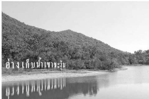
อ่างเก็บน้ำเขาชะงุ้ม

ช วงใกล้เทศกาลส่งท้ายปีเก่าต้อนรับปีใหม่ หลายพื้นที่เตรียมปรับปรุงพัฒนา เพื่อต้อนรับนักท่องเที่ยวที่จะมาท่องเที่ยวช่วงวันหยุดยาวที่กำลังจะมาถึงนี้ โดยที่โครงการศึกษาวិธีการฟื้นฟูที่ดินเสื่อมโทรมเขาชะงุ้ม อันเนื่องมาจากพระราชดำริ ต.เขาชะงุ้ม อ.โพธาราม จ.ราชบุรี ถือเป็นอีกหนึ่งแหล่งท่องเที่ยวที่สำคัญของจังหวัด และเป็นที่น่าสนใจของนักท่องเที่ยวอันดับต้นๆ ของประเทศ ที่จะต้องพาครอบครัวมาเที่ยวพักผ่อนวันหยุดในช่วงเทศกาลต่างๆ