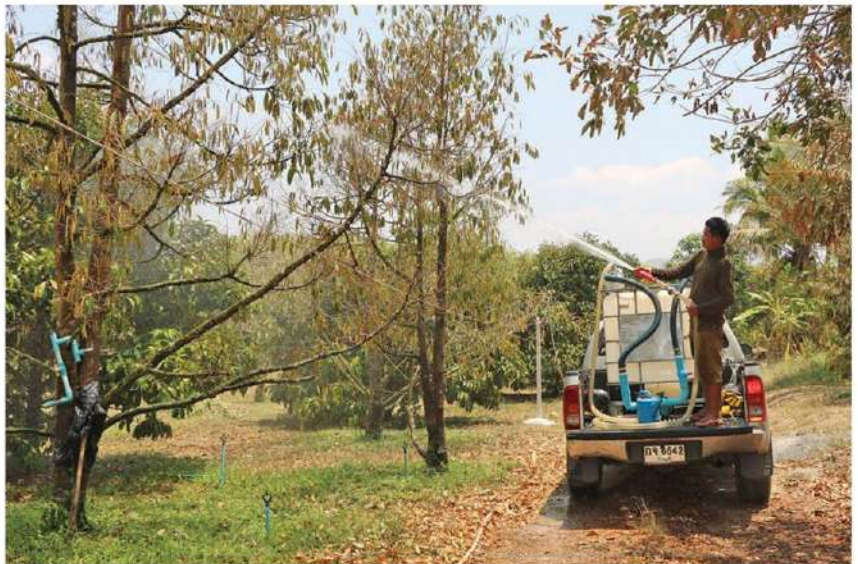
ฝนทิ้งช่วง - เกษตรกรผู้ปลูกผลไม้ใน ต.ยางหัก อ.ปากท่อ จ.ราชบุรี ต้องซื้อน้ำมารดต้นทุเรียนและผลไม้อื่นทั้งมังคุด เงาะ ลองกอง ในสวน หลังประสบปัญหาภัยแล้ง ฝนทิ้งช่วง ไม่มีน้ำรดต้นไม้ในสวน จนยืนต้นแห้งตายเกือบยกสวน เมื่อวันที่ 27 เม.ย.

โดยผลการตรวจจากอากาศในช่วง 24 ชม.ที่ผ่านมา จ.นครราชสีมา มีอุณหภูมิสูงสุดพุ่งสูงถึง 43.1 องศา และวันนี้ (27 เม.ย.) อุณหภูมิเฉลี่ยสูงถึง 43 องศา จากสภาพอากาศที่ร้อนจัดต่อเนื่องมาหลายสัปดาห์ ทำให้ปริมาณน้ำเก็บกักในอ่าง