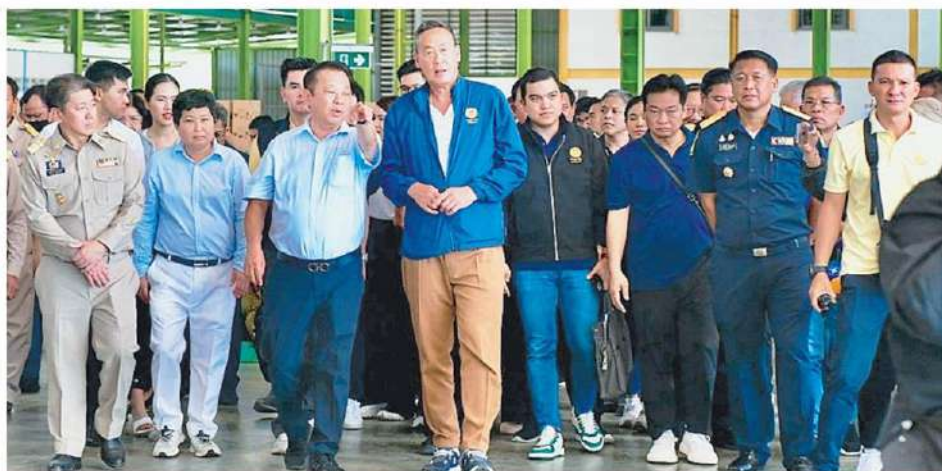
ดูละเอียดย ผู้บริหาร บ.ตราคอน เฟรช ฟรุท จำกัด อ.มะขาม จ.จันทบุรี นำ นายเศรษฐา ทวีสิน นายกรัฐมนตรี และ รว.คลัง ชมโรงงานคัดบรรจุทุเรียนและอธิบายขั้นตอนการส่งออก.