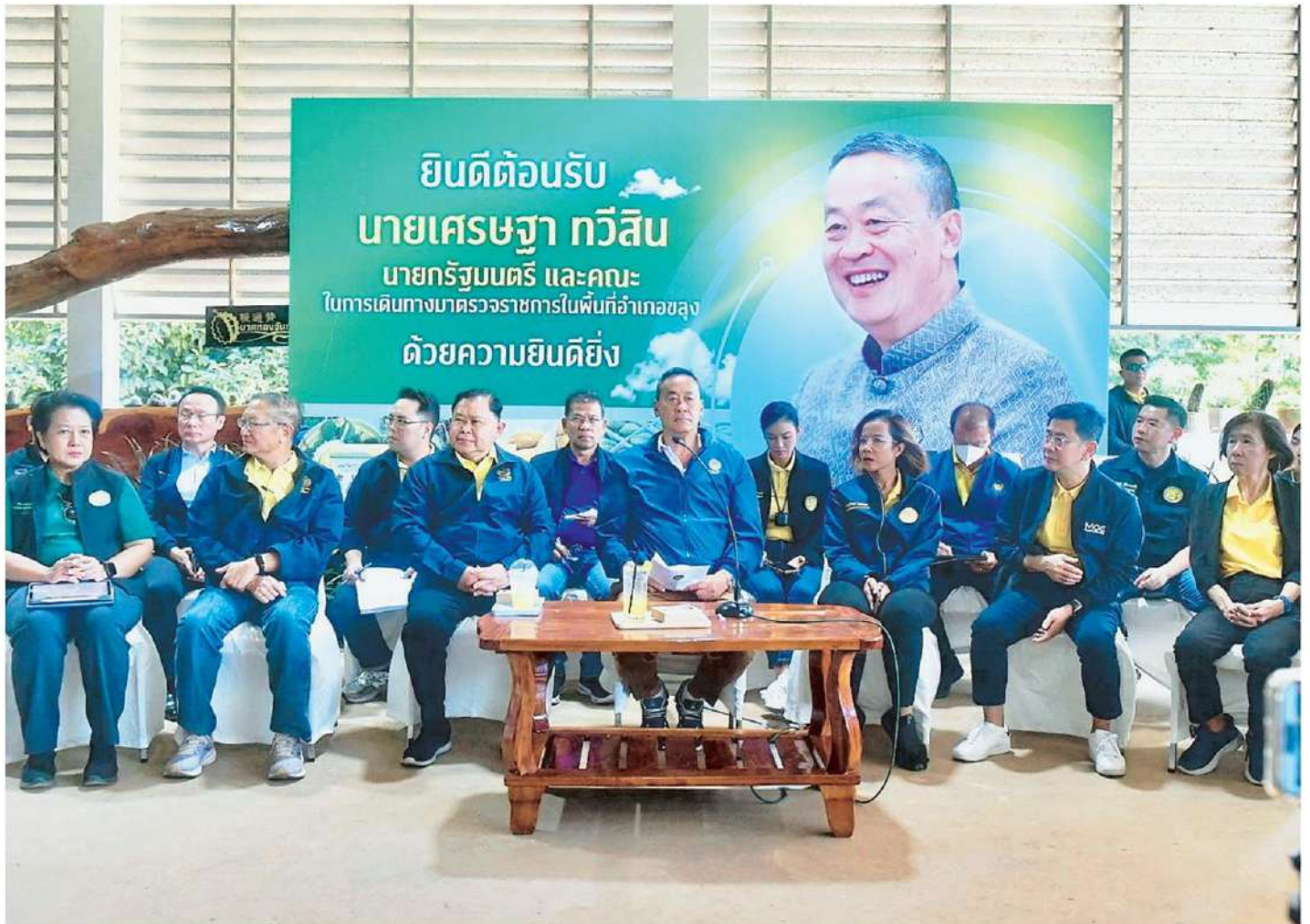
โปรโมตทุเรียน นายเศรษฐา ทวีสิน นายกรัฐมนตรี และ รว.คลัง นำคณะรัฐมนตรี ได้แก่ น.ส.พิมพ์ภัทรา วิชัยกุล รว.อุตสาหกรรม นายไชยา พรหมา รว.เกษตรและสหกรณ์ ไปตรวจเยี่ยมสวนทุเรียนและรับฟังปัญหาการส่งออกทุเรียนไทย โดยพบปะตัวแทนภาคเอกชน ที่ บ.ตราคอน เฟรช ฟรุท จำกัด อ.มะขาม จ.จันทบุรี.