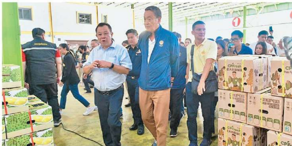
บรรจุส่งออก นายเศรษฐา ทวีสิน นายกรัฐมนตรีให้ความสนใจการคัดแยกคุณภาพทุเรียน และการบรรจุเพื่อส่งออก พร้อมเยี่ยมชมห้องเย็นแช่แข็งทุเรียนด้วย.