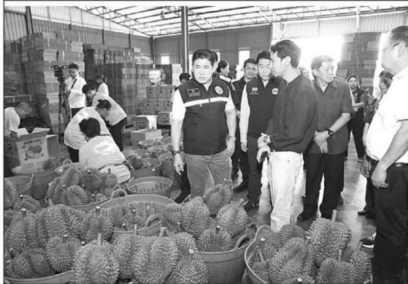
ตรวจทุเรียน : ร.อ.ธรรมนัส พรหมเผ่า รวบรวมเกษตรกรและสหกรณ์ ประชุมผู้ประกอบการโรงคัดบรรจุผลไม้ภาคตะวันออก ฤดูกาลผลิตปี 2567 ที่ จ.จันทบุรี พร้อมกับลงพื้นที่ตรวจสอบคุณภาพทุเรียนตามข้อตกลงพิธีสารที่จะส่งออกไปยังประเทศจีน เพื่อรักษามาตรฐานทุเรียนไทย สร้างความมั่นใจให้แก่ผู้บริโภค