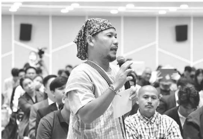
กลุ่มชาติพันธุ์เสนอแนะ กม.โลกร้อน