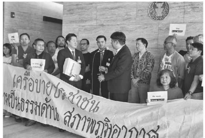
ภาคีเครือข่ายภาคประชาชนยื่นร่าง พ.ร.บ.โลกร้อน

ก ารเปลี่ยนแปลงสภาพภูมิอากาศสร้างผลกระทบต่อทั่วโลก ไทยเจออากาศร้อนต่อเนื่องยาวนาน น้ำทะเลอุ่นจนปะการังฟอกขาวทั้งอ่าวไทยและอันดามัน สภาพอากาศร้อนและแล้ง ฤดูฝนล่าช้า ส่งผลพืชผักเสียหาย กระทั่งภาคเกษตร ปัญหาเหล่านี้ยิ่งเตือนถึงผลกระทบจากภาวะโลกร้อนที่รุนแรงเพิ่มขึ้น หลายฝ่ายหาแนวทางแก้ปัญหาดูดอกหมूमี่โลก ในวันที่ร่างพระราชบัญญัติการเปลี่ยนแปลงสภาพภูมิอากาศ พ.ศ. ... ที่มีชื่อเล่นเรียกว่า "กฎหมายโลกร้อน" ซึ่งเชื่อว่าจะนำไปสู่การลดการปลดปล่อยก๊าซเรือนกระจกอย่างมีประสิทธิภาพ คาดว่าจะเสนอคณะรัฐมนตรีภายในปี 2567 นี้ จะสนับสนุนให้ประเทศไทยสามารถบรรลุเป้าหมายการปล่อยก๊าซเรือนกระจก (GHG) สุทธิเป็นศูนย์ภายในปี ค.ศ.2065 แต่ทว่าในหลายหมวดหลายมาตราในร่างกฎหมายโลกร้อนฉบับรัฐบาลนี้ มีเสียงวิพากษ์วิจารณ์เป็นใบเบิกทางให้ภาคอุตสาหกรรมไทยปิดความรับผิดชอบผ่านการซื้อขายสิทธิในการปล่อยก๊าซเรือนกระจก รวมถึงความเหลื่อมล้ำจากระบบภาษีคาร์บอน