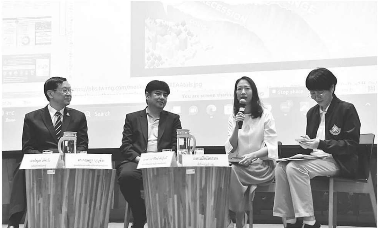
กสม.เปิดเวทีเทียบร่างกฎหมายโลกร้อน 4 ฉบับ

รับผิดชอบ ใครได้รับผลกระทบต้องเยียวยา ร่างพระราชบัญญัติการเปลี่ยนแปลงสภาพภูมิอากาศ พ.ศ. .... จะเป็นเครื่องมือช่วยดูแลเป้าหมายลดก๊าซ อีกส่วนสิทธิในดำรงชีวิต สิทธิด้านสุขภาพ กฎหมายนี้เอื้อการมีส่วนร่วมของทุกภาคส่วน และอีกส่วนสำคัญมาก กฎหมายนี้สะท้อนให้เห็นถึงผลการดำเนินงานของไทยต่อสาธารณะว่าเดินไปถึงไหน นอกจากนี้ กำหนดดกลไกราคาคาร์บอน