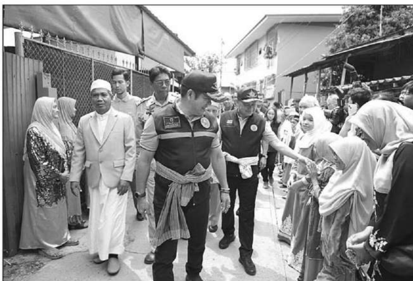
ติดตาม : ร.อ.ธรรมนัส พรหมเผ่า รมว.เกษตรและสหกรณ์ ติดตามการดำเนินงานวิสาหกิจชุมชนกลุ่มแปรรูปอาหารฮาลาลเนื้อสัตว์เพชรบุรี ต.ท่าแร้งออก อ.บ้านแหลม จ.เพชรบุรี ขับเคลื่อนนโยบายสินค้าเกษตรและบริการมูลค่าสูง 1 ท้องถิ่น 1 สินค้าเกษตรมูลค่าสูง เพิ่มช่องทางตลาด จำหน่ายทั้งในและต่างประเทศ

ในส่วนกระทรวงเกษตรฯ มุ่งขับเคลื่อนนโยบายสินค้าเกษตรและบริการมูลค่าสูง 1 ท้องถิ่น 1 สินค้าเกษตรมูลค่าสูง โดยสำนักงานปศุสัตว์ จ.เพชรบุรี ได้ฝึกอบรมการแปรรูปเนื้อสัตว์ สนับสนุนปัจจัยการผลิตในการเลี้ยงโคเนื้อ ตั้งเป้าหมายในการเพิ่มช่องทางตลาดการจำหน่ายทั้งในและต่างประเทศให้เพิ่มมากขึ้น